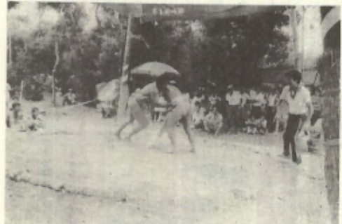
須賀の森六雙園において相撲大会の一のこったのこった一

何時の時代か定かでないが、参勤交替の制度盛んな頃であろうが、数種の崇敬深い八幡神社々地の後、松之森に祀られぬの身辺を守護のため信者に供つて祀られた例祭は、それは、盛んで上は伊予郡泊瀬から下は三