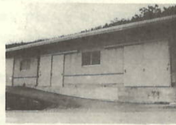
塩成集会所新築工事 鉄筋コンクリート造り平屋建床面積172.50㎡ C=22,350,000