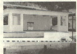
作業場及び冷蔵庫1棟