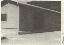
農産物共同集荷所新築工事 鉄骨造り平屋建(2棟)床面積 200.20㎡ C=7,306,000

ごみ収集に御協力を ごみ収集時間の変更について五月一日より、収集開始時間午前七時三十分、従来より一時間早くになりましたので、充分気をつけて搬出して下さい。 昭和五十三年度ごみ収集従事者紹介 佐々木 茂治 大江 佐々木 利子 大江 今年度より、収集業務に従事することになりましたので、御協力をお願い致します。 ●住みよい、快適な環境を作る為にも、次の点に注意して下さい。 一、野火、猫、腐敗による悪臭防止の為、出たごみは、よく水を切り、包装の多い可燃物は、燃物の混入はしないよう出しましょう。 二、指定した場所へ出しましょう。 三、悪臭、不衛生防止の為、水分の多い可燃物は、燃物の混入はしないよう出しましょう。 四、燃物、不燃物の混入はしないよう出しましょう。 五、燃物、不燃物の混入はしないよう出しましょう。 六、燃物、不燃物の混入はしないよう出しましょう。 七、燃物、不燃物の混入はしないよう出しましょう。 八、燃物、不燃物の混入はしないよう出しましょう。