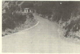
町道足成灯台線舗装新設工事 L=890m W=2.1~4.2m C=8,324,250