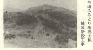
町道みどり権現山線舗装新設工事 L=1,429m W=0.7~8.8m C=14,583,750