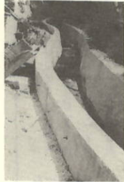
三面明渠8ヶケ処L=325.4m C=17,080,000 トラブ伏設10ヶケ処L=670.9m