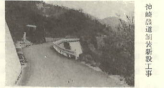
神崎農道別荘新設工事 L=680m W=2.95~4.6m C=6,486,250

号炉の交付金額は三億四千百三十三万二千円、二号炉では四億八千八百七十七万五千円が交付決定し、総額八億二千九百五十万七千円という巨費が交付されるわけですが、 そこでこの巨額予算をどのような事業に使うか整備計画がたてられていて、その計画に基づいて町づくりが進められるわけですが、 この交付金を使って、どんな施設ができるかといった写真をもっと紹介します。