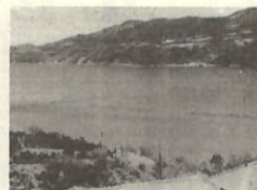
ワカメ筏1基 生寸12基