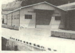
農産物共同貯蔵所(三机)新築工事 鉄骨造り平屋建床面積288.00㎡ C=9,605,000