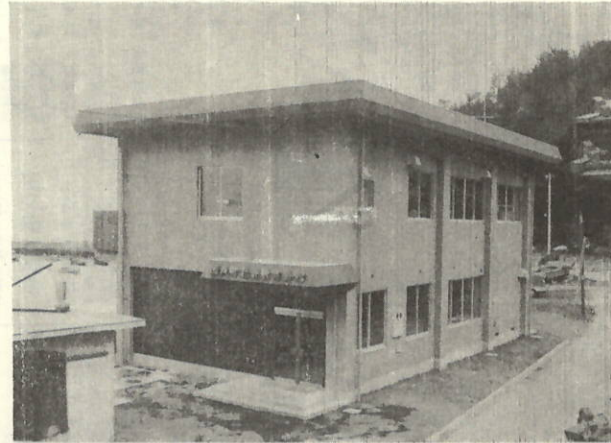
(瀬戸町社会教育会館)

昭和51年4月20日 / 発行: 愛媛県西宇和郡瀬戸町 / 編集: 瀬戸町総務課