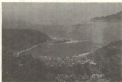
瀬戸十景紹介 須賀の森

んの前年分の所得金額をもとにして、ことし予定納税していただく金額を計算し、所得税第一期分の納税額としてご通知し