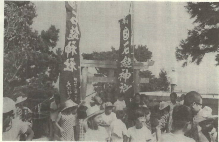
石鎚神社の祭礼風景 (権現山)