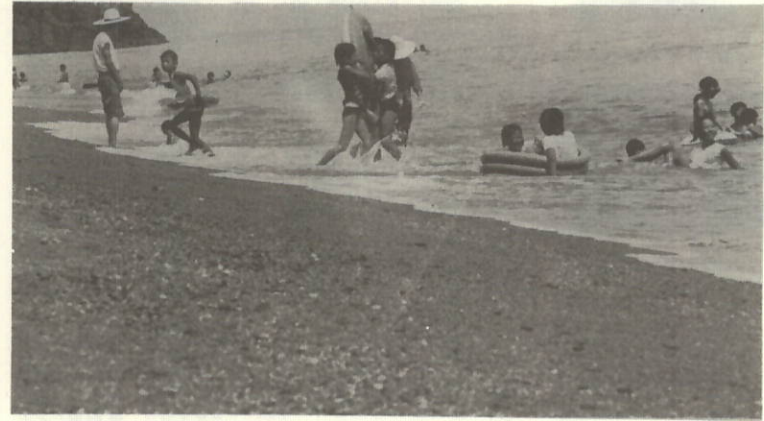
夏ノ水泳シーズンたけなわ(大久海岸)