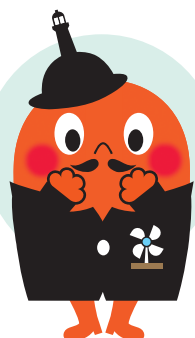
伊予町イメージキャラクター「サダンディー」