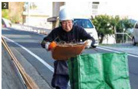
1 児童生徒たちの通学路を清掃 2 多い時は袋10杯分の落ち葉があります。

仁田之浜の一宮神社から白崎公園近くまでの約600mほどの道路はいつも綺麗に掃除され、すっきりとしています。近所の方が日常的に掃除するのに加え、仁田之浜地区にお住いの宇都宮さんがボランティアで道路清掃を行っているからです。