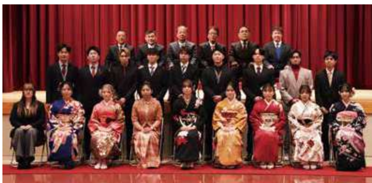
【瀬戸地域・三崎地域】