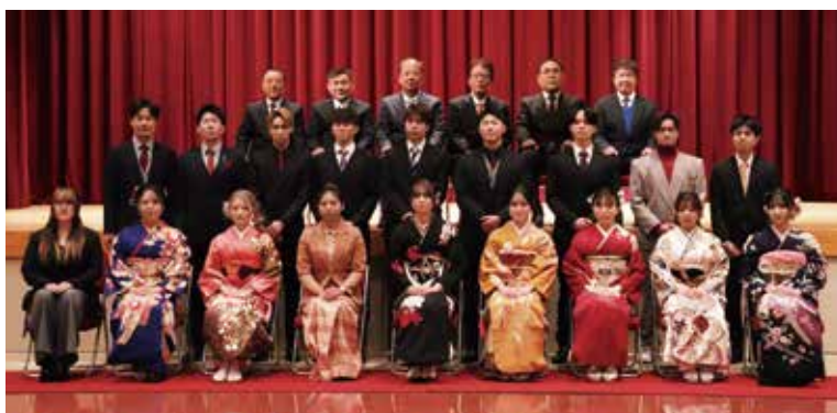
【瀬戸地域・三崎地域】