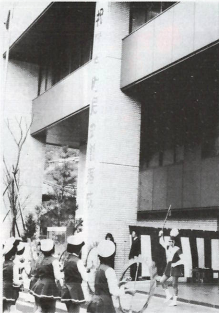
伊方小学校児童による鼓笛隊の行進やファンファーレも落成式の警意気を盛り上げました。