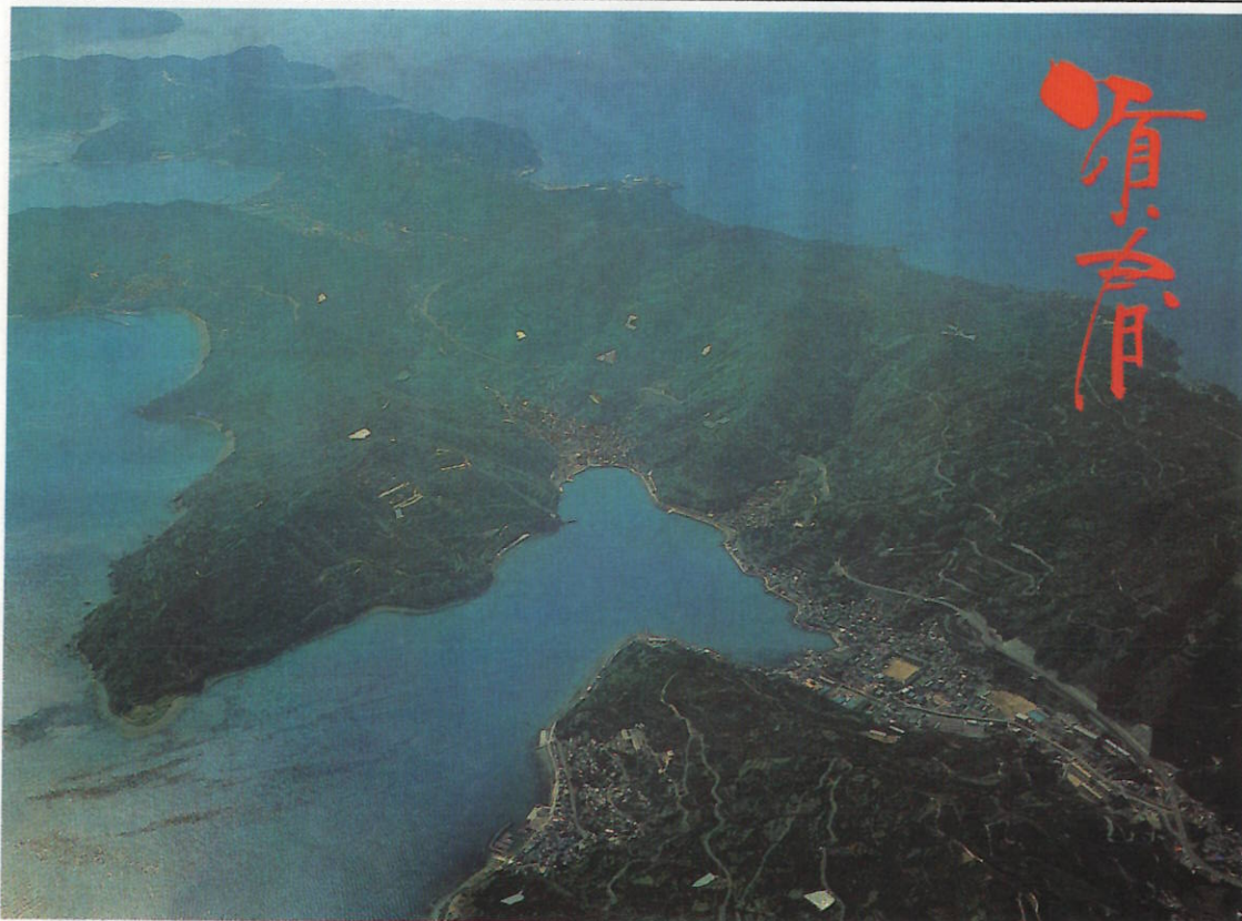
生活基盤の整備など豊かで住みよい町づくりの青写真が着々と進む本町。新国道・南子用水の早期実現が望まれます。

二面……町民会館落成記念行事のご案内 三面……郷里の思い出 四面……歳時記、お知らせ