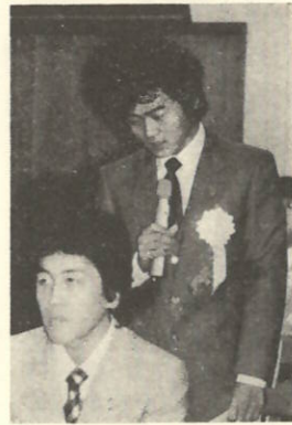
ちょっぴり緊張ぎみの自己紹介

一月十五日は「成人の日」でありました。この日全国でおよそ五百五十万人、県下では一万八千五百七十人が晴れて、大人の仲間入りをしました。