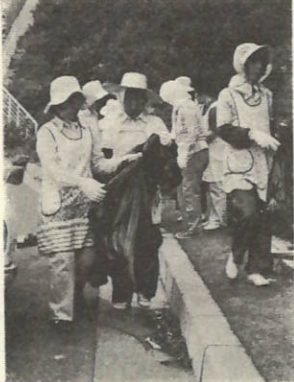
国道沿いの清掃をする婦人会の方々 町では、新しく新たに五カ所にクリーンボックス（ゴミ箱）を設置しました。きれいな町づくりにご協力ください。

時代の流れとともに、私たちの生活様式は大きく変化し発展してきました。日常生活から出るゴミの量も年々増えて増えています。とも言うべき、それを使った後、ゴミの処理問題が大きな問題を取りあげられました。ゴミ問題は、私たち一人ひとりが主役なのです。たかが一人ぐらい、たかがこれくらいがみんなの生活環境を悪くしているのです。 今月は、こうした私たちの生活と切りはなすことができない「ゴミ」問題をとりあげました。ゴミ問題は、私たち一人ひとりが主役なのです。たかが一人ぐらい、たかがこれくらいがみんなの生活環境を悪くしているのです。