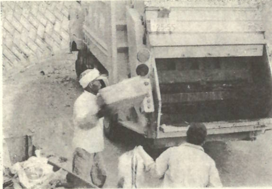
ゴミを集める人が困っています。きちんと袋詰をして、水気をよく切ることをお忘れなく!!