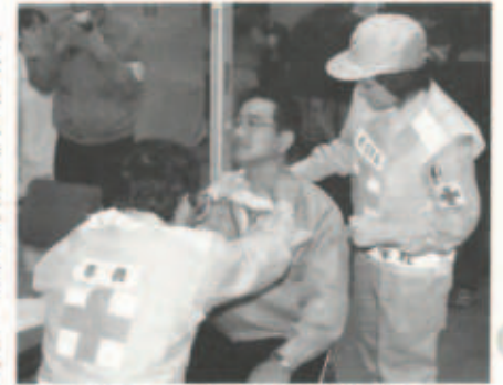
▲医師の診療を受ける避難住民