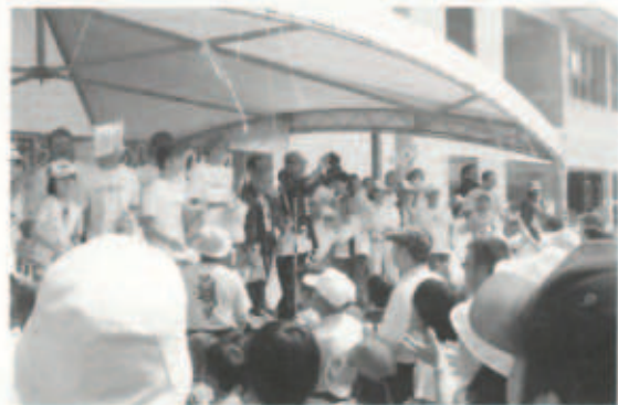
▲7/25 きなはいや伊方まつり