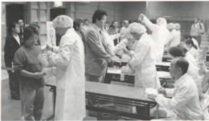
▲スクリーニングを受ける避難住民