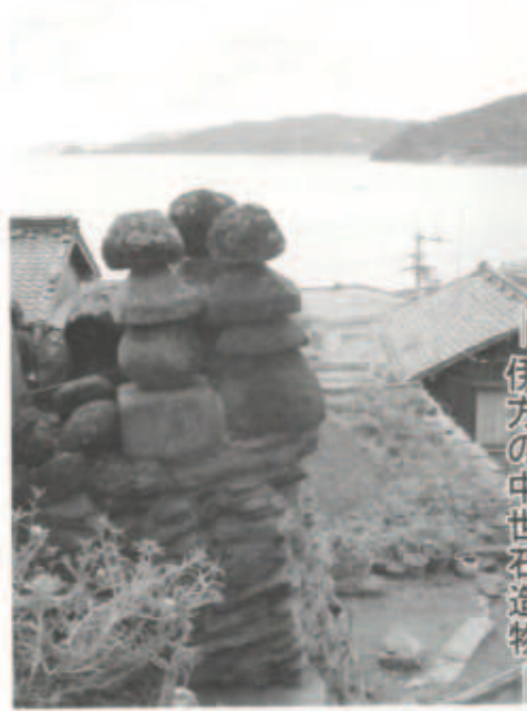
伊方の中世石造物

2005年2月27日まで 町内に数多く残る「ごりんさま」。 伊方のあちこちに歴史の断片が！ 路傍の石も見逃さない！