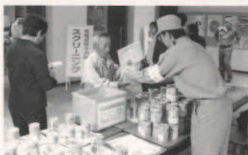
▲ 非常食を受け取る避難住民

オフサイトセンター(緊急事態応急対策拠点施設)で行われた運営訓練では、国など関係者約150名が参加し習熟を図りました。今後、現地と首相官邸を結んでテレビ会議等を実施する大がかりな訓練も予定されています。今年度は次のような想定で8項目の訓練が行われました。