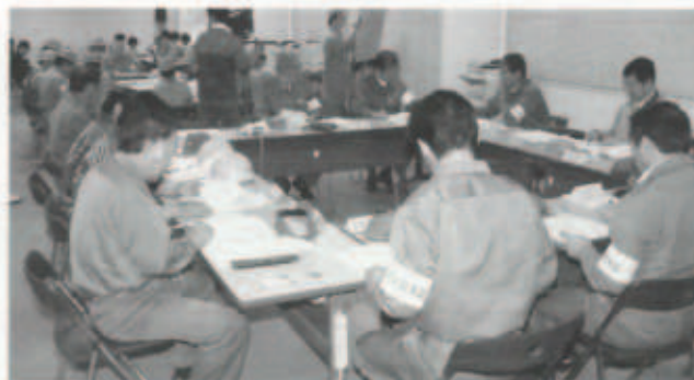
▲ 伊方町災害対策本部

伊方発電所の事故を想定した原子力防災訓練が10月26日(火)に町内を中心に実施され、今年度は37機関2千200人が参加しました。