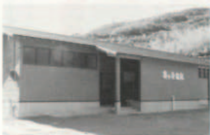
▲10/13 亀ヶ池温泉「仮設温泉温浴施設」が完成