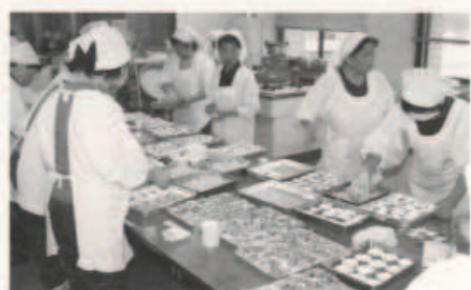
▲ 食料供給を行う給食班

10月26日(火)午前8時30分に伊方発電所において、異常事態が発生し、原子炉を手動停止することとした。 風向：南西、風速2m/秒