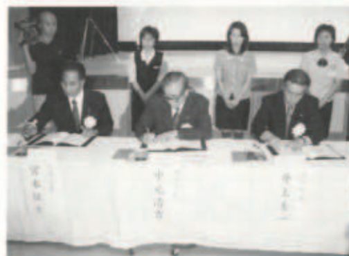
▲9/9 伊方町・瀬戸町・三崎町 の三町による合併協定書調印式(調印を行なう三町の町長)