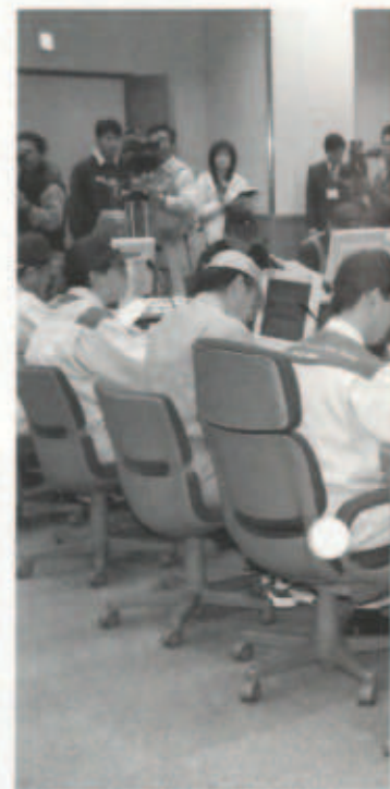
▲原子力災害合同対策