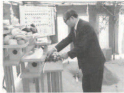
▲6/10 町生涯学習センター 起工式