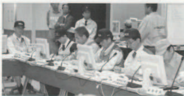
▲ オフサイトセンター内(6階)

今年で15回目を数える原子力防災訓練は、有寿来地区を防護対策区域に設定、住民による地区外避難訓練などが行われました。また、町内すべての学校・保