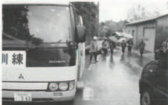
▲ 地元消防団員の誘導で避難する住民(亀浦地区)

伊方発電所の事故を想定した原子力防災訓練が10月26日(火)に町内を中心に実施され、今年度は37機関2千200人が参加しました。