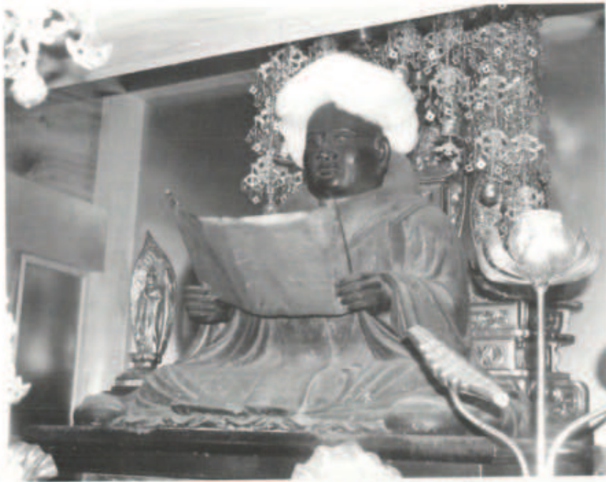
わたぼうしを被った日蓮聖人像（2004年11月14日撮影）

二年後となりますが、その建物には、近世期から八幡浜浦で栄華を誇った庄屋浅井家の屋敷（現在の八幡浜市民会館の位置にありました）が移築されました。船で何度も往復してその部材を運んだそうです（ただしその後老朽化が進んだため平成12年に改築され、現在