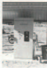
▲10/15 貯溜槽・温泉スタンドが完成