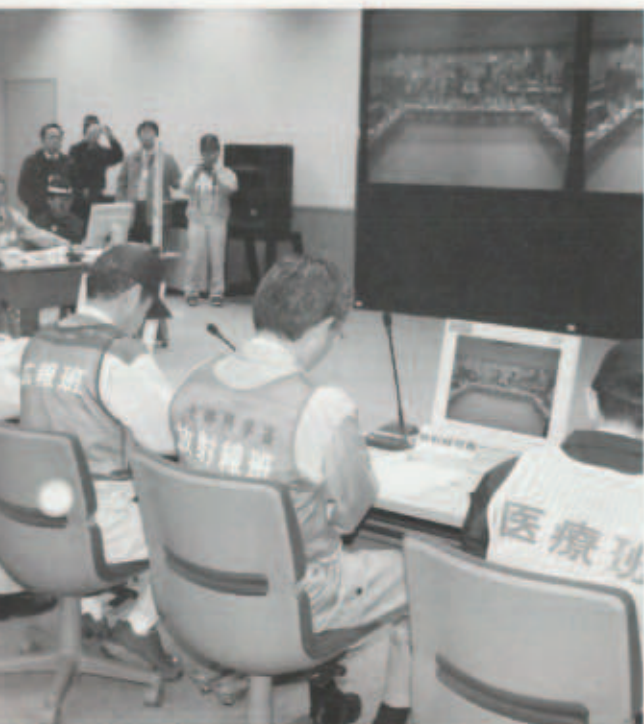
協議会(国・県・伊方町・保内町・瀬戸町・発電所等)

今年で15回目を数える原子力防災訓練は、有寿来地区を防護対策区域に設定、住民による地区外避難訓練などが行われました。また、町内すべての学校・保