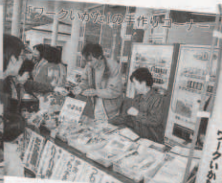
フークいめたの手作りコーナー