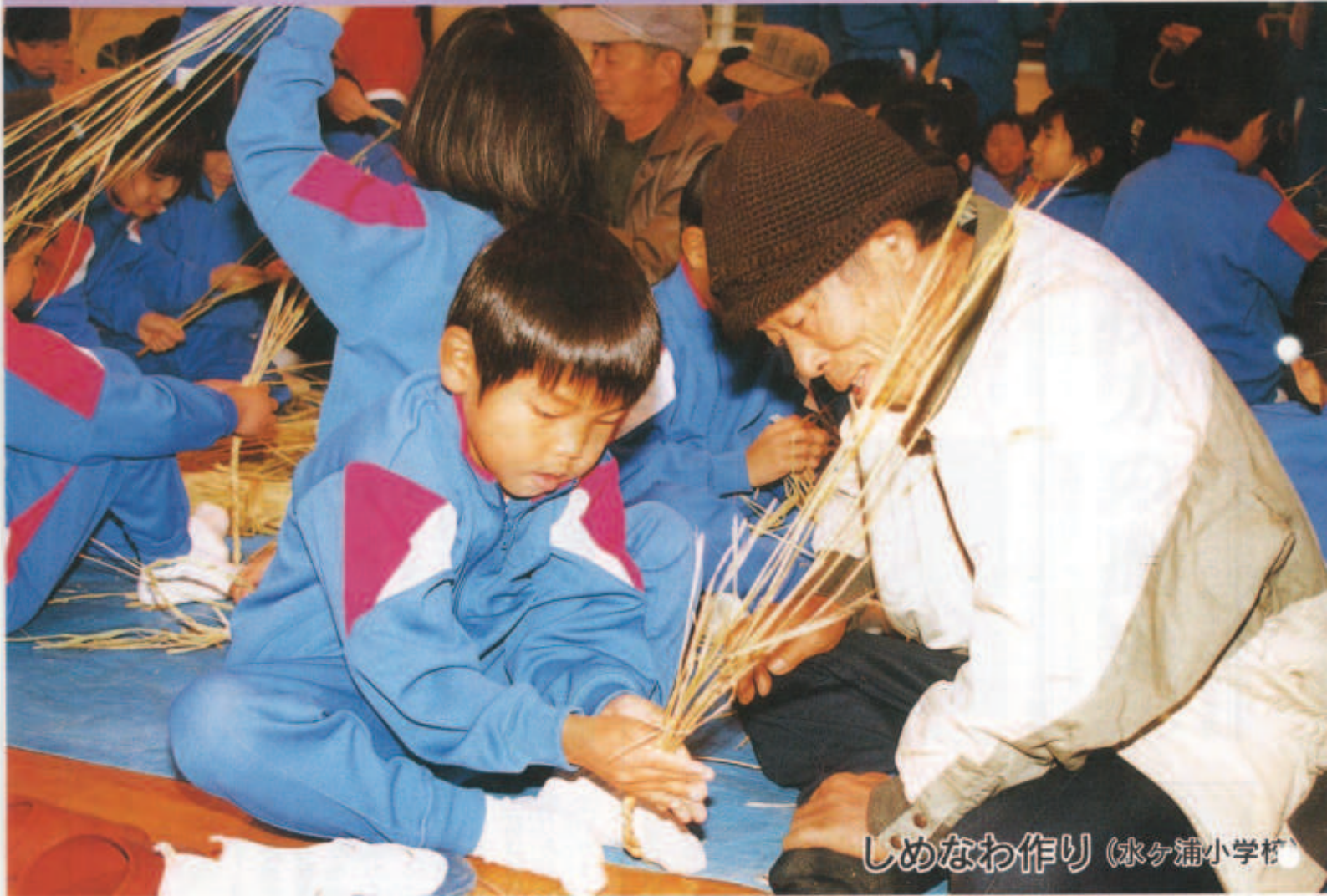
しめなわ作り (水ヶ浦小学校)