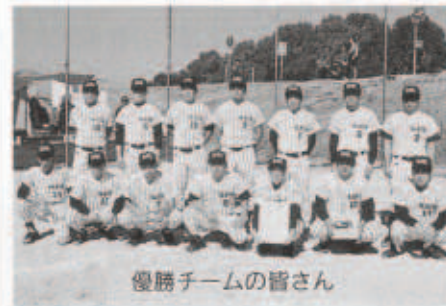
優勝チームの皆さん