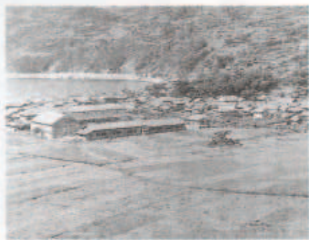
「昭和30年頃の九町 中央の塚が沖の城」