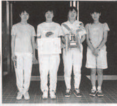
▲バドミントン女子優勝チーム