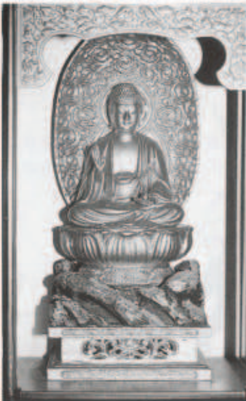
お薬師さんの名があるゆえ

古屋敷では、毎年一月八日の初薬師を例祭にきめて、ご縁日には、あちこちから大勢の参拝者が来なはるけん、お接待やなにかしもありますげ。お薬師さんは、集会所内の特設祭壇に安置され、地区住民の人たちが交代で供養し、仏前の燈火を守り続けており、お薬師さんは私たちの生活に根ざした仏さまで、土地の歴史そのものですらしい。