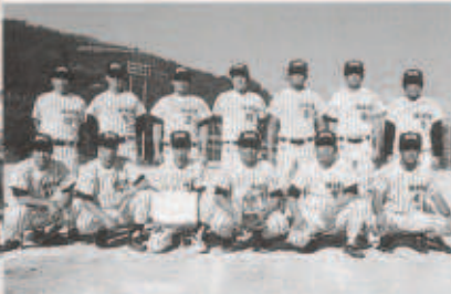
▲ソフトボール(30代)優勝チーム

8月29日(日)第19回西宇和郡体育祭愛媛スポレク祭'99地方大会郡予選が、伊方町民グラウンドを主会場とし、スポーツセンターなど5会場で、バレーボール、ソフトボール、卓球、ソフトテニス、バドミントンの