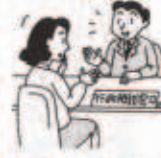
秋の行政相談週間 (10月17～23日)