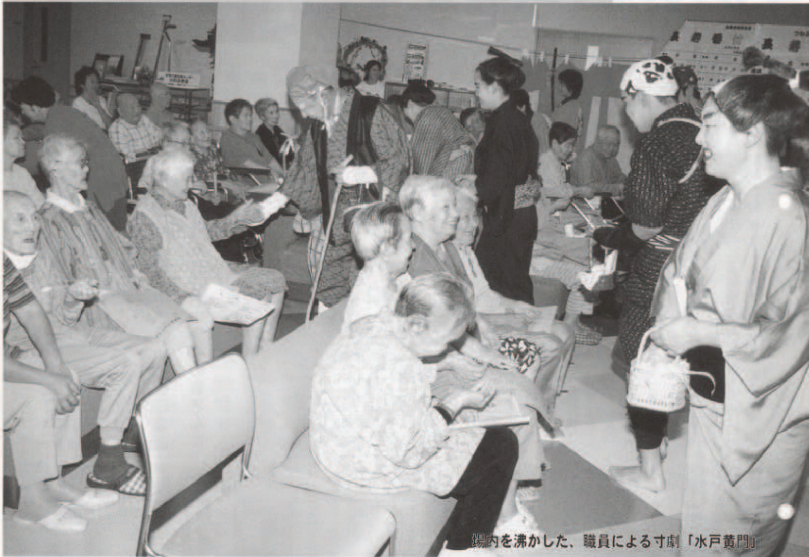
場内を沸かした、職員による寸劇「水戸黄門」