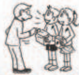
赤い羽根共同募金 (10月1日～)