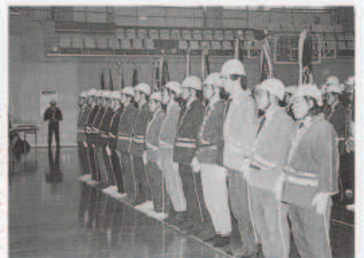
▲八西消防団連合会長表彰