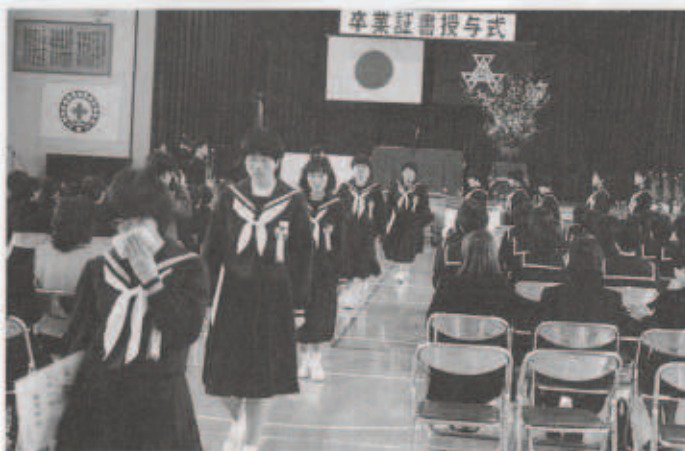
▲ 閉校した町見中（3/17卒業式）

今年もはや師走の12月、平成10年も残すところ後わずかになりました。みなさんのご家庭での一年間はどうかでしたでしょうか。本町においてもいろいろな出来事や話題がありました。 今年2月に北海道泊村と姉妹町村縁組を締結、同村公民館で調印式が行われました。3月には特別養護老人ホーム「つわぶき荘」が湊浦に完成しました。伊方中と町見中が統合され、4月から新生伊方中学校が開校しました。また、5月には指定ごみ袋制度がスタートしました。10月には台風10号が襲来、大きな爪あとを残していきました。 一年間の締めくくりにあたり、町の出来事を表にして振り返ってみました。