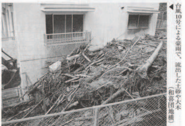
▲台風10号による豪雨で、流出した土砂や大木（和喜団地横）