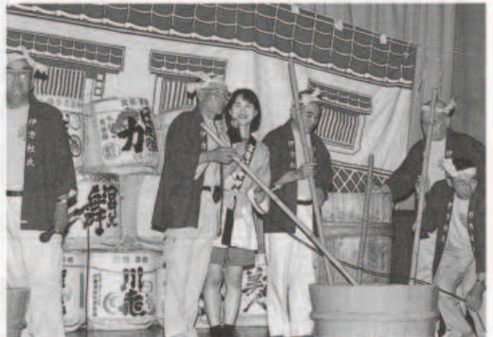
▲今年も盛況だった「きなはいや伊方まつり」（7/26社氏の里酒まつり）