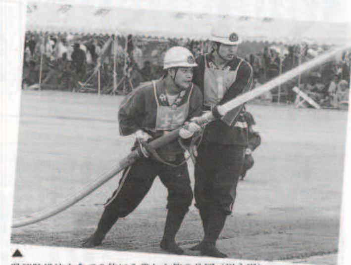
▲県消防操法大会で3位に入賞した第8分団（川永田）