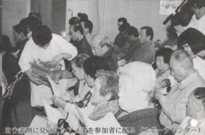
保健栄養推進協議会の皆さんによる炊き出し (伊方中調理室) 目ウ毒剤に見立てたラメ紙を参加者に配る (スポーツセンター)