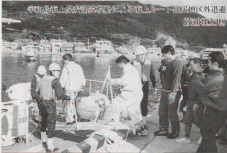
宇和島海上保安部巡視船による海上ルード住民地区外退避 (長浦埋立地) 体育館へ避難する児童 (伊方小)