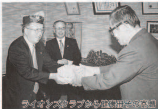
ライオンズクラブから健康冊子の寄贈

寄贈いただいた冊子は、健康読本シリーズ第19号「心臓死と脳卒中を防ぐために」で、心臓病と脳卒中、およびその原因となるコレステロールについて掲載されています。この冊子は、各地区の区長さんを通じて、町内全戸へ配布されます。