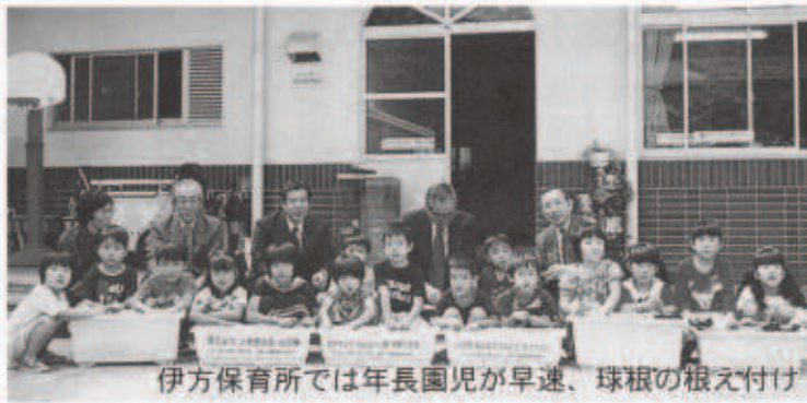
伊方保育所では年長園児が早速、球根の根え付け

この人権の花運動は、花の栽培を通じてやさしい思いやりの心を持った子どもにも育つてもらおうと、人権啓発活動の一環として実施されています。今年もチューリップとフリジアの球根が町内全保育所へ贈られ、人権擁護委員の方