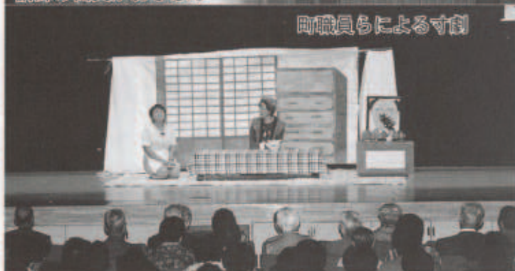
町職員らによる寸劇