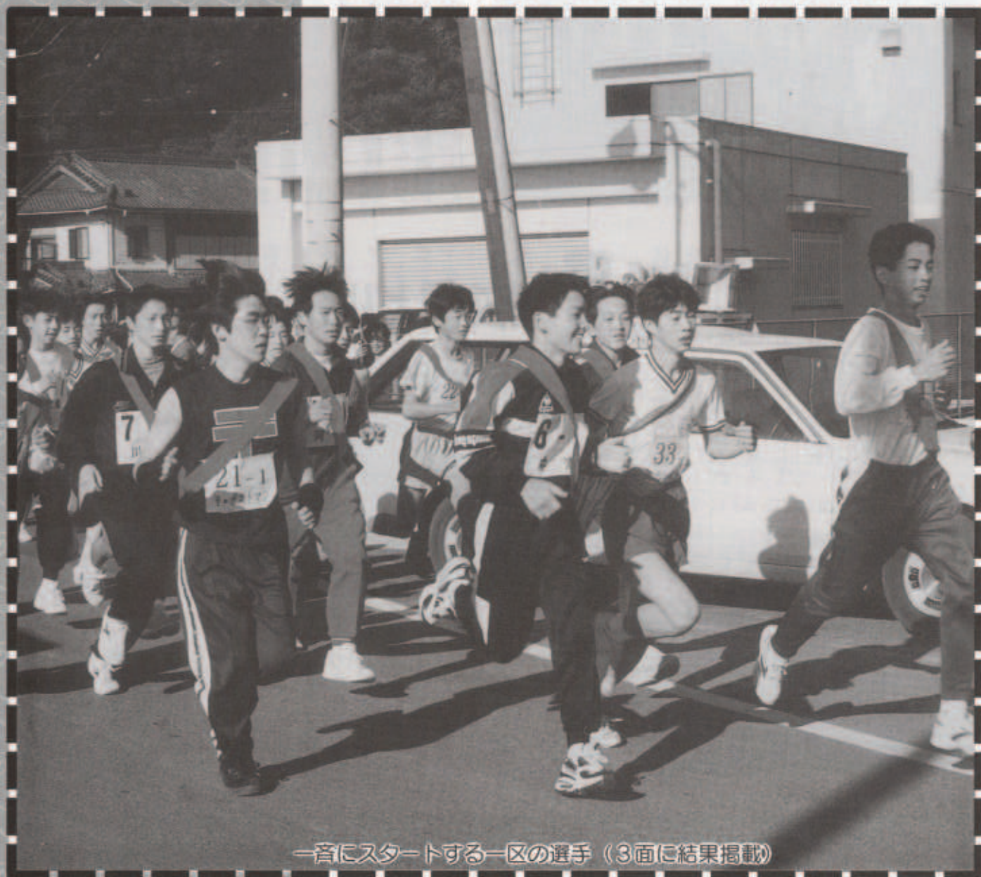
一斉にスタートする一区の選手 (3面に結果掲載)