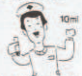
ドナー登録は、院からの採血検査です

パンフレット請求先・愛媛県保健環境部薬務課 ☎(089)941-2111(内線3130)