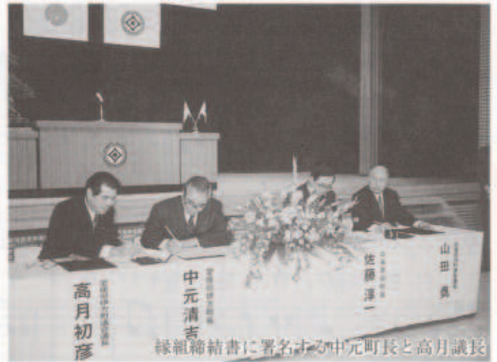
縁組締結書に署名する中元町長と高月議長