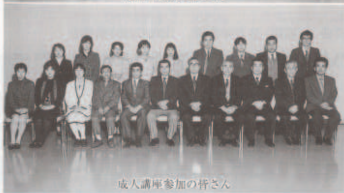
成人講座参加の皆さん