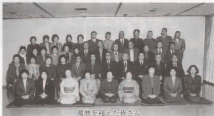
還暦を迎えた皆さん

写真撮影のあと、懇親会が開かれ、伊方特産のみかんジュースで乾杯。福引きやカラオケで盛大に厄払いを行いました。