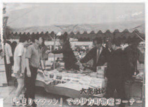
「とまりマラソン」での伊方町物産コーナー