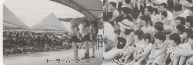
セーラームーショウ