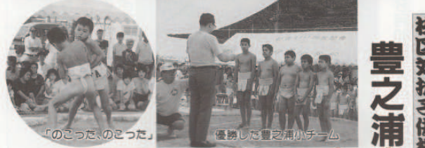
「のこった、のこった」