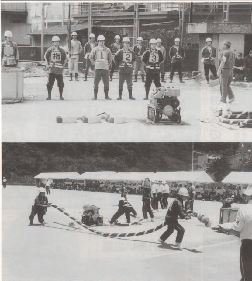
炎天下の中、きびきびとした操法を披露しました。

今月の紙面 二面……94きなはいや伊方まつり 三面……町章・町民憲章・ 町のキャッチフレーズの募集 ふるさとウォッチング 四面……健康づくりの標語募集 歳時記「白露」