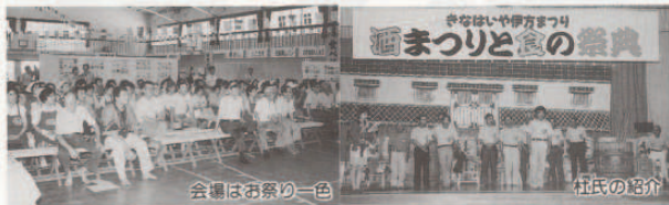
会場はお祭り一色