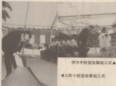
伊方中学校改築起工式▲ ▲九町小学校改築起工式

伊方中学校の起工式には、施工業者の(株)大任建設、設計監督者の(株)四国建築設計事務所、町側から町長・助役・収入役・教育長・教育委員・PTA会長・学校長・児童代表(男女各一名)など関係者多数が列席し、玉串奉奠、町長のクワ入れの儀が挙行されました。鉄筋コンクリート二階建一九六八二七㎡のこの校舎は、総工費一億千八百九十六万五千円で、完成は、明年二月末と目指しています。スタートしたわけです。