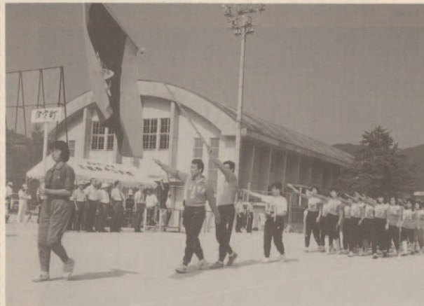
伊方町選手団の力強い入場行進