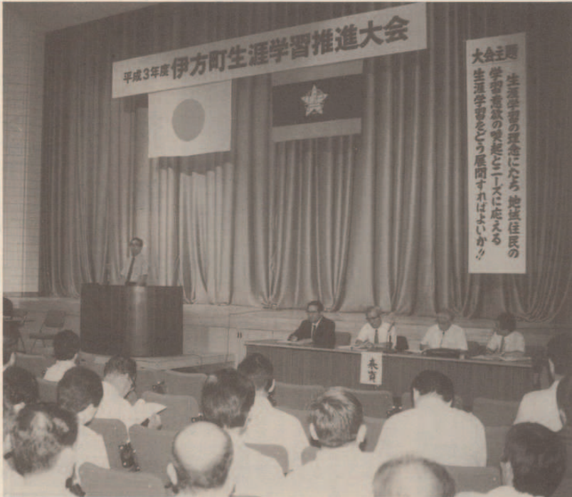
大会主題 生涯学習の理念にたち、地域住民の 学習意欲の喚起と「二一」に へる生涯学習をどう展開すればよいか。

生涯学習の理念にたち、地域住民の学習意欲の喚起と「二一」に へる生涯学習をどう展開すればよいか。を大会主題に、八月 二十五日、中央公民館で生涯学習推進大会が開催されました。 大会には、教育関係団体はじめ、行政関係団体、経済団体、 行政関係職員、教育関係職員ら一〇〇余名が参加し、伊方町の 生涯学習推進のあり方について研究協議を行いました。その結 果、具体的展開を期する為、「ひとり一学習」「ひとり一活動」 「ひとり一スポーツ」を推進目標に設定することを参加者の賛同 を得て大会決議されました。