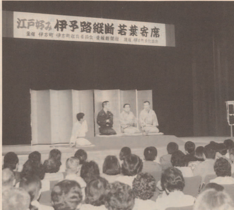
寄席の最後は4人で大喜利、場内は笑いが絶えません