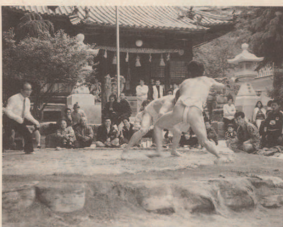
団体、個人戦ともに参加が増えて賑わいをみせた