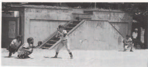
ねらいすましてカーン