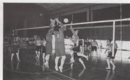
アタック (女子一部)