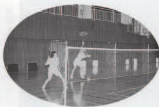
ジャンピングスマッシュ