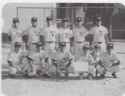
ソフトボール30代優勝