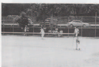
一勝をもぎとった女子ダブルス