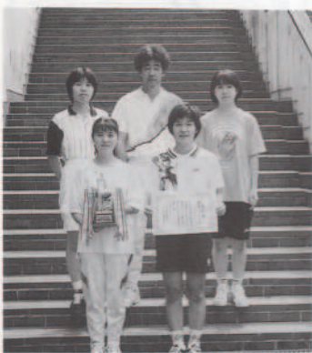
バドミントン女子優勝