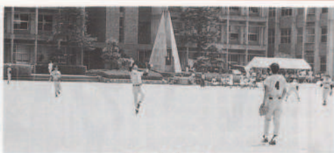
オーライ オーライ