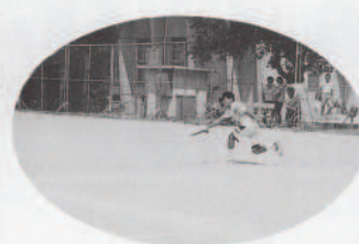
惜しかったソフトテニス