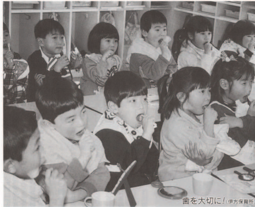
歯を大切に!(伊方保育所)