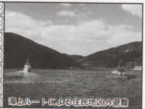
海上ルートによる住民地区外避難