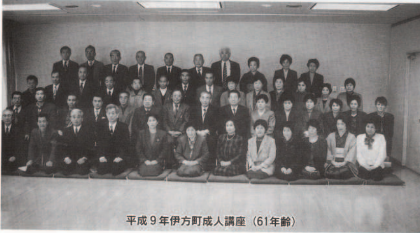
平成9年伊方町成人講座 (61年齢)