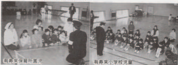
有寿来保育所児童