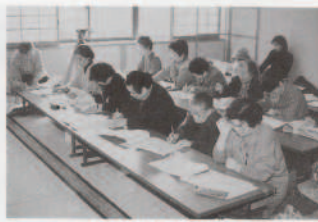
熱心に選句する会員