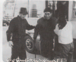
ライオンハウスセンターへ避難