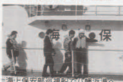
海上保安部巡視船で八幡浜港へ

1月30日(木) 平成8年度愛媛県原子力防災訓練が実施されました。この訓練は、緊急時における災害対策の習熟と防災関係機関の相互協力体制の強化を図るとともに、住民の皆さんに原子力防災に対する理解の促進を目的としています。訓練想定及び訓練項目は次のとおりで、住民避難誘導訓練には約150名の参加がありました。また、亀浦地区では併せて自主的な訓練も行われ、住民が集会所へ避難しました。