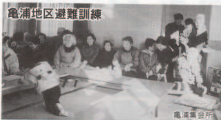
亀浦地区避難訓練