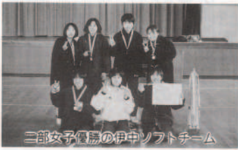
三部女子優勝の伊中ソフトチーム