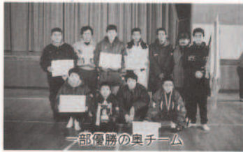
一部優勝の奥チーム