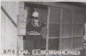
各戸をまわり、避難の呼びかけ(亀浦分団)