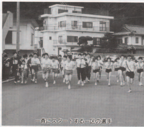
一斉にスタートする一区の選手