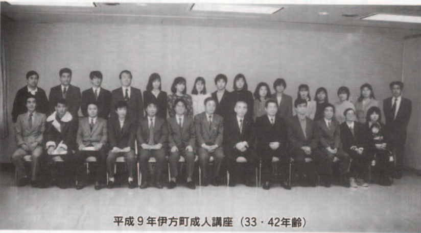
平成9年伊方町成人講座 (33・42年齢)