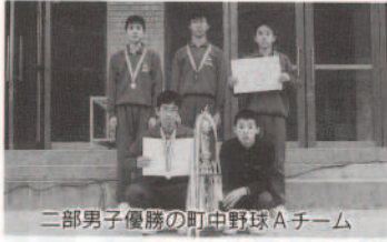
二部男子優勝の町中野球Aチーム