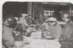
自衛隊と協力して炊き出し