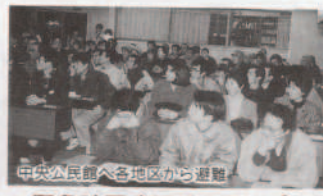
中央公民館へ各地区から避難