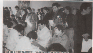
健康状態を問診(救護所、八幡浜消防本部)