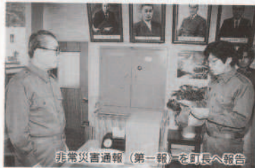
非常災害通報(第一報)を町長へ報告