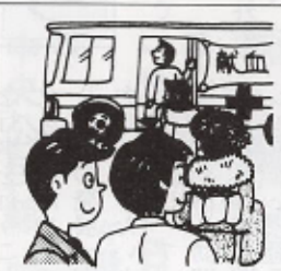
はたちの献血キャンペーン (1月6日〜2月5日)