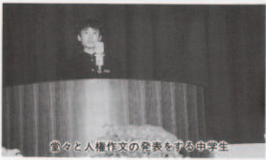
堂々と人権作文の発表をする中学生

この日は、町同和教育協議会の委員、役員、地域推進員やその他関係者など百五十〇余名が出席。開会行事では、中元町長が「今研究大会は十回目の節目であり、もう一度、本町の同和教育のあり方を見直し、差別のない明るい町づくりにつとめよう」と開会あいさつが行われた。