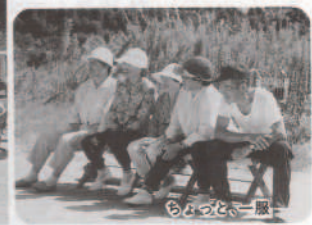
さわやかな秋晴れの下、開催されました