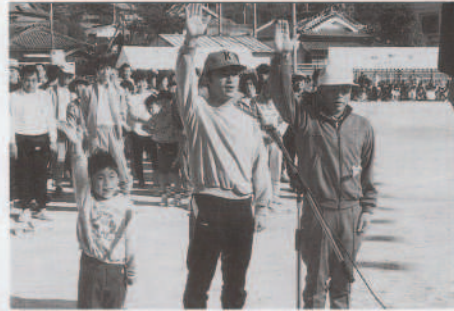
▲三根主家三世代にちなみ選手宣誓