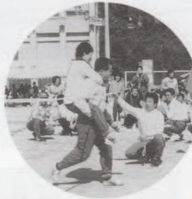
▲お父さんのガンバリで ジャンケン、ジャンケン