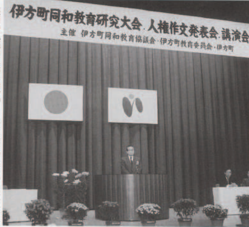
伊方町同和教育研究大会・人権作文発表会・講演会 主催 伊方町同和教育協議会・伊方町教育委員会・伊方町