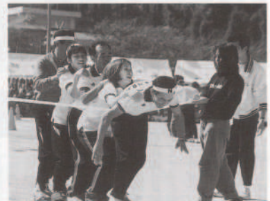
▲倒れながらゴールインするむかて競争