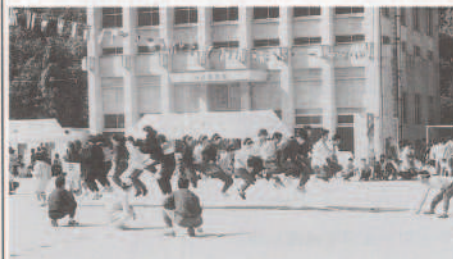
▲息の合ったジャンプでイチ・ニ・サン