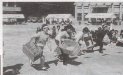
▲ミカン取りの最盛期前にコンテナを手は何処へ