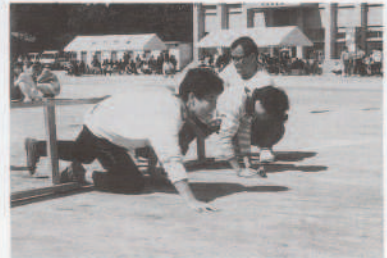
▲ダイエットをしてよかったわ?