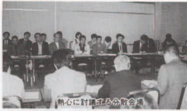
熱心に討議する分談会場

差別の現実から深く学び、未来を保障するため、地域ぐるみで同和教育を推進しようと、「町同和教育研究大会」が十月二十一日に中央公民館で開催された。