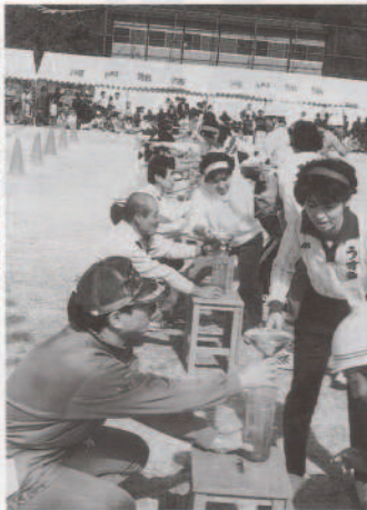
▶水も滴る……男もこれで台無し