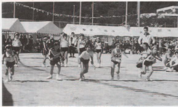
▲小中合同リレーで元気にスタートする一年生