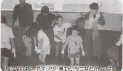
いけすの中は、ヤス・アシ・車エビ・タコなどがいっぱい