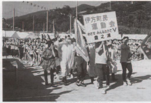
▲思考を凝らしての入場行進