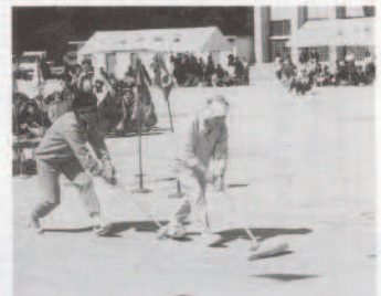
▲気の向くままピンの転るままに四苦八苦