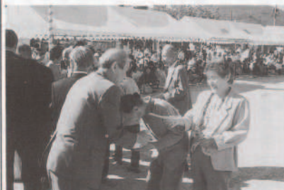
▲「いつまでもお元気で」と景品が贈られる宝さがし