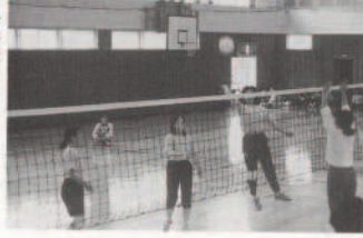
町小学校 バスケケットボール大会