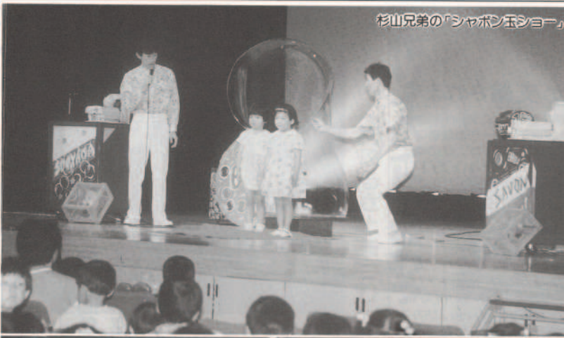
杉山兄弟の「シャボン玉ショー」