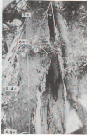
文化財保護審議委員会と、修復を検討中です。 このナギの木は、七百年前この地に根をおろして、私達の暮しを、見守ってきた。これからは、早く元気にさせて、守り続けて欲しいものです。 (中浦 法通寺境内)