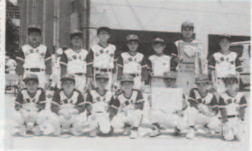
町見地域対抗 バレーボール大会