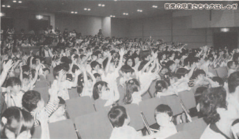
客席の児童たちも大はしゃぎ