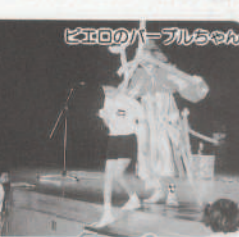
ビエロのパープルちゃん

ミニジカルなどの曲をメドレーで、会場いっぱいに歌い上げました。 フィナーレは出演者全員がステージに登場し、盛大の内に幕を閉じました。 この日参加された保護者や児童は、親子で楽しいひとときを過ごせたことでしょう。