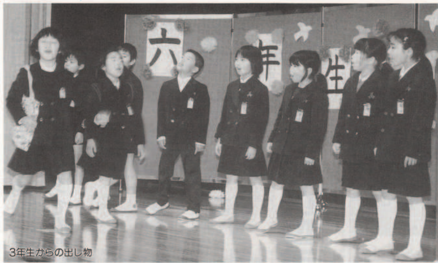
3年生からの出し物

今月の紙面 二面……4月9日印は愛媛県議会議員選挙 ねんきんコーナー 三面……恒例の町消防団出初式 ヤングプロフィール④ 四面……園場コンクールで農林水産大臣賞 歳時記「臘月」