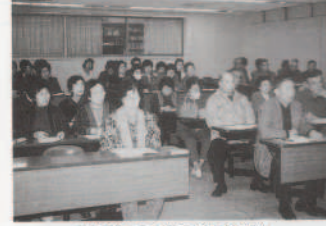
研修会に参加された皆さん

ボランティア活動の大切さが叫ばれている。本町でもボランティアの輪が広がっていくことではないかと、