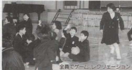
全員でゲーム、レクリエーション

3月20日月、九町小学校(清水昭伸校長)で「6年生を送る会」が催されました。 送る会では、1～5年生(60名)が各学年ごとに発表(出し物)を行い、6年生(11名)に感謝の気持ちを表しました。 その後、みんなで楽しくゲームを行いました。