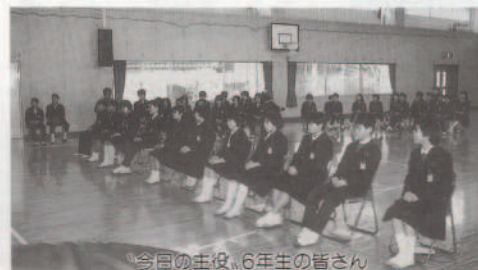
今日の主役、6年生の皆さん

3月20日月、九町小学校(清水昭伸校長)で「6年生を送る会」が催されました。 送る会では、1～5年生(60名)が各学年ごとに発表(出し物)を行い、6年生(11名)に感謝の気持ちを表しました。 その後、みんなで楽しくゲームを行いました。