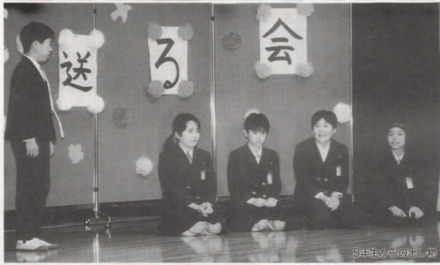
5年生からの出し物