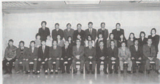
平成7年 伊方町成人(33・42年齢)講座

午後からの懇親会では、歌や踊りも飛び出し、同級会のように和やかな雰囲気の中で行われていました。