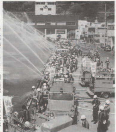
毎年恒例の一斉放水(役場前物揚場)