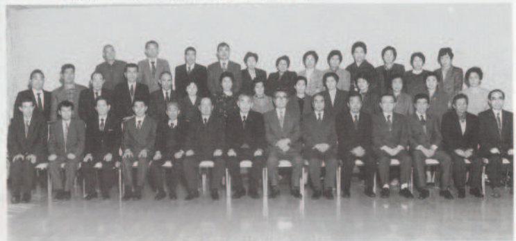
平成7年 伊方町成人(61年齢)講座