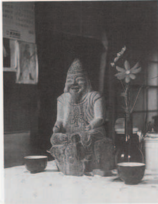
女子岬に祀られていた恵比須さま

これは勿体ないことじやと、掘った後、海の潮水できれいに洗って、浜で縄で拾うて縛り、棒にさして家に担うて帰りました。丁寧に祀りしりませうが、恵比須様といえはな、狩衣、指貫、伊折烏帽子のいでたてで、右手に釣り竿、左腕に宝珠をお持ちです。御影石造りで、高さが四十二釐ほどあります。今では、毎日お酒を上げ「まあ一杯飲みなはいや」というは、自分も一杯す飲みます。この恵比須様を掘り起してからは、沖へ魚釣りに出ても、ただこ（不漁）で帰ったことはありません。 掘りに行って、牡蠣うちのようなお餅で掘りよつたら、何ぞ固い物がひつかつたので、おそれおそれ掘つてみよつたら、だんだん頭や顔が現われ、鯨の先にひつかつたのは、恵比須様の風折烏帽子じやい。これを所から不思議なことに、この恵比須の石像じやありません。遊びに来てみないや。そりや、とても絶景ですぞう。