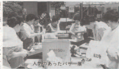
人気のあったバザー展

五月二十二日(日)、向公民館主催のふるさとまつりが開催されました。心配された天気も熱気に圧倒されたのか、快晴となり一安心。ふるさとまつりも第六回を迎え準備等の手際も慣れたものでスムーズに進められた。