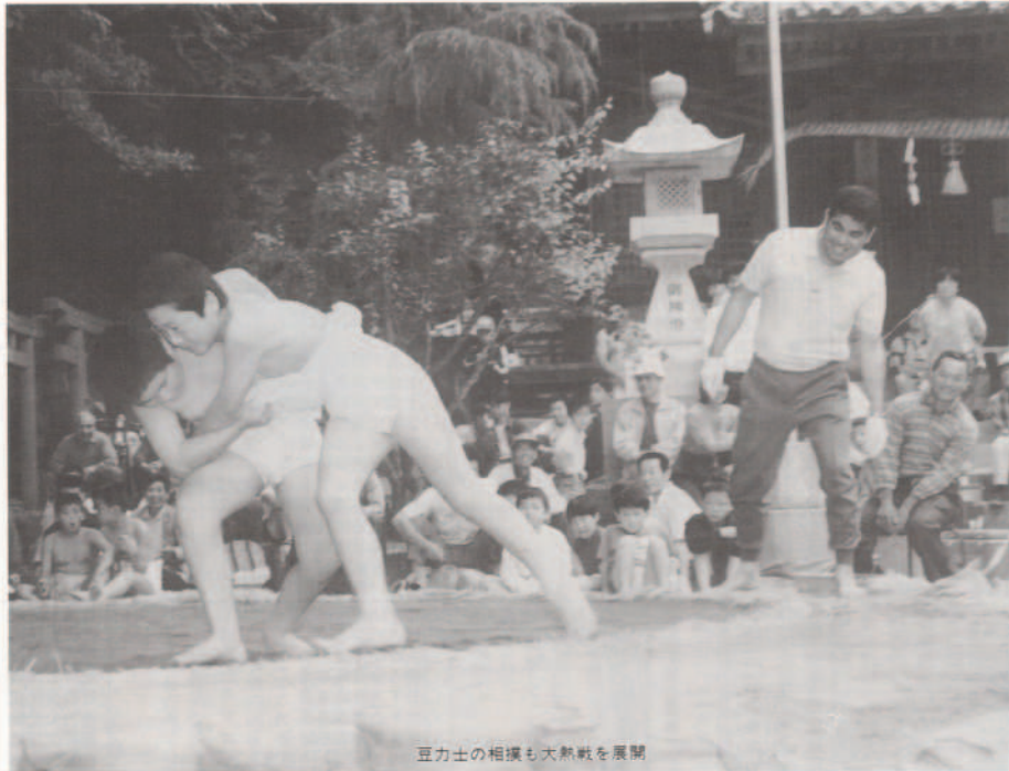
豆力士の相撲も大熱戦を展開