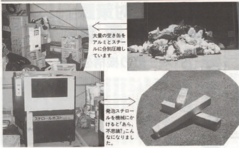
大量の空き缶をアルミとスチールに分別圧縮しています

「私たちが暮らしていくうえで必ず出るゴミ。」「ゴミを出す時、決められた日、決められたルールを守っていますか。」