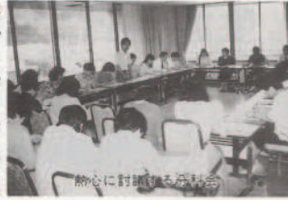
熱心に討議する分科会

開会行事終了後、さっそく四つの分科会に別れて、単P、学級P、支部Pなどの活動について、郡内各地の現状や課題の情報交換を行い、指導者としての役割と実践の方策を熱心に討議していました。また、午後からは、伊方中学校に会場を移し、交流を兼ねていただくことを期待します。