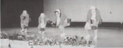
仁田之浜老人クラブの安映節

「伊方町の特性を活かした生涯学習のあり方を考える」を大会主題に平成5年度伊方町生涯学習推進大会が三月二十六日、中央公民館で開催された。 この日は、教育関係団体役員、行政関係団体、経済団体など百余名が出席、開会行事のあと、中元町長より、「町づくりと生涯学習」と題して、生涯学習を推進する上での課題や今後の施策などについて基調講話が行われた。 続く、実践事例発表では、