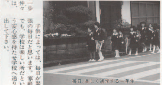
毎日、楽しく通学する一年生

また、保護者の皆様には、遠くは立て、立てば歩めの親心が、本日はより一層の喜びがあらうかと思えます。私たち教職員十七名が最善の努力を傾けて参りたい」とあいさつ。 式が終ると、一年生は担任の先生といっしょに教室へ入り、学校での生活のことやきまりなどの説明に元気の返事が教室に響いていました。