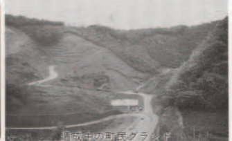
造成中の町民ランド

国民健康保険会計 この会計は、事業勘定と直営診療施設勘定の2つに分かれています。事業勘定には、国民健康保険に加入している皆さん方が、診療の際に支払う医療費の一部を計上しており、今年度は5億5469万円となっています。 また、直営診療施設勘定には、九町診療所の運営費を、1億690万円計上しており、両方をあわせると6億6159万円となっています。