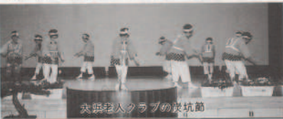
大浜老人クラブの筑坑節

グループ活動を通して、仲間づくりや地域の催し物などに社会参加を目的に活動している大浜、仁田之浜老人クラブ有志の皆さんです。