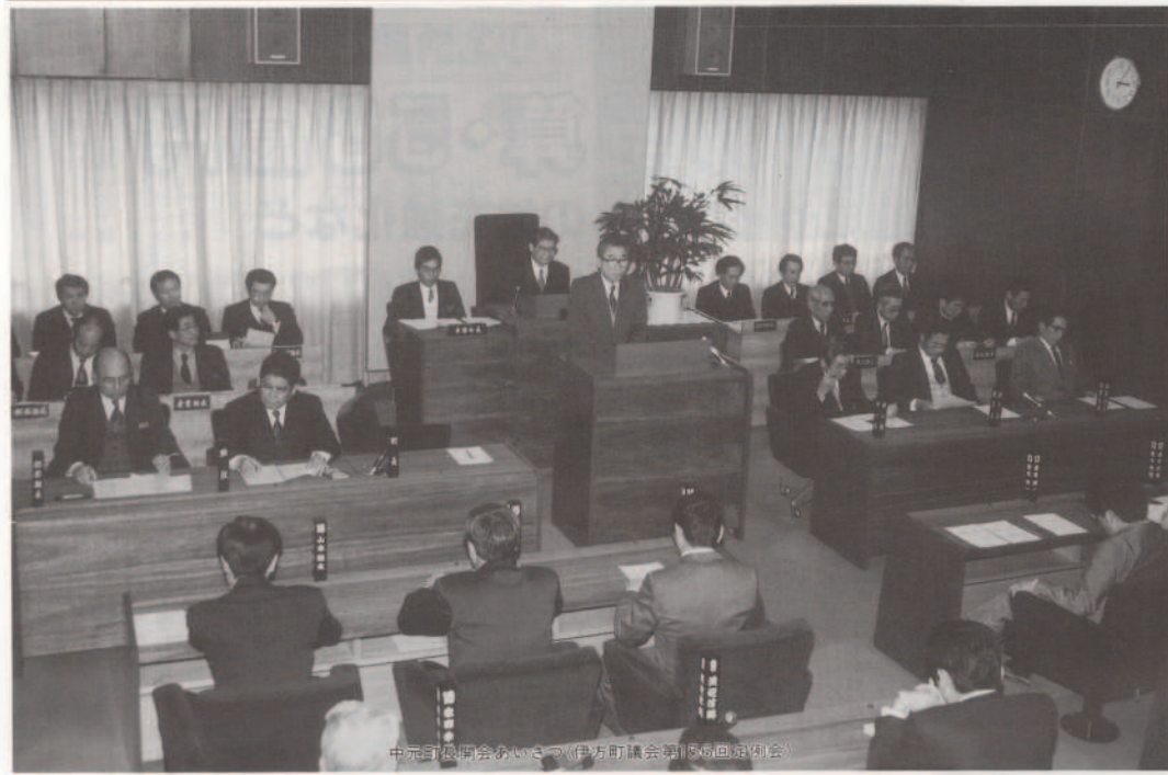
中元町長開会あいさつ(伊方町議会第156回定例会)