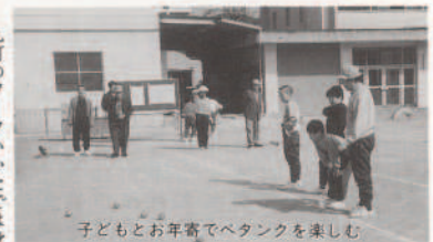
子どもお年寄りでペタンクを楽しむ