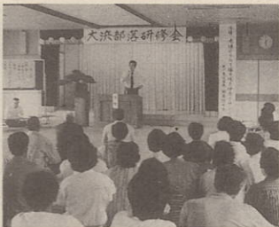
柑橘生産学習・大浜(元年)

「この難しい時代に、趣味やスポーツに打ち込んだり、社会奉仕なんかのんびりやっていたらいいか……」 このように思つておられる方もあるのではないのでしょうか。では、あなたの生業についてもっと工夫の余地はないでしょうか。農業所得を多くするには、生産に対する学習が大きくモノを言います。魅力ある商店街をつくるには各人が、又は地域がもっとやるべきことがあるはずですよ。