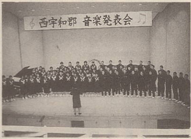
美しい唄声で合唱を行う町見中

図書室の利用者と貸出し数が年々増加しているのに蔵書数が増えません。そこで、年末の大そうじの際に、いらなくなった本がありましたら、中央公民館図書室への寄贈をお願いします。(雑誌類除く) 又、長期間貸出中になっている本も多数あります。年内には返本して下さい。 年末年始の休館 図書室は十二月二十八日から一月六日まで休館します。新年は一月七日からです。