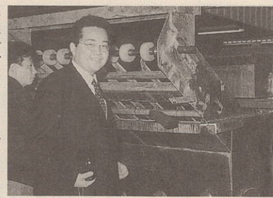
日本市場に輸出するサーモン工場にて

無休で、その六割が個人経営の専門店である。日頃、駐車場確保が経営の重要な問題で、立体駐車場でも一台当り百万円近くかかる日本とは、大変な違いである。 日本市場に輸出するためのサーモン工場、オーク材の製材加工工場なども視察したが紙面の都合で別の機会に報告させて頂くことにします。国際化、情報化、高齢化が予想される日本社会で、海外の実状にふれることは、生きた教材に接するようで、大変有意義だと実感しました。 最後に、今回の視察研修で学んだこと、体験したことを町民の一人として、又商工会員の立場でこれからの「まちづくり」に生かしたいと存じます。