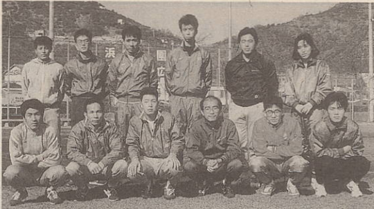
二部3位の入賞を喜ぶ伊方体協

十一月二十四日、「佐田岬半島メロデーライン駅伝競走大会」(主催佐田岬半島観光推進協議会)が行われ、本町から出場した伊方体協が健闘し、二部で三位入賞を果しました。