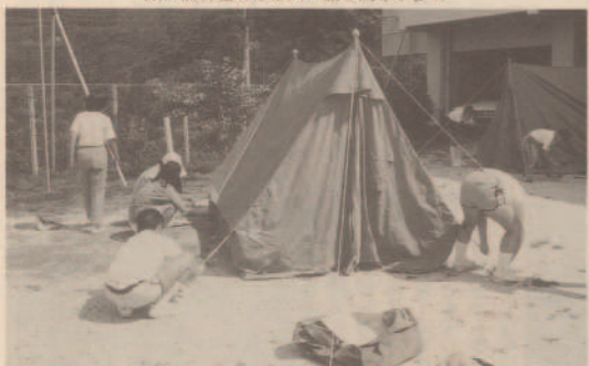
全員でテント設営、上手にできました