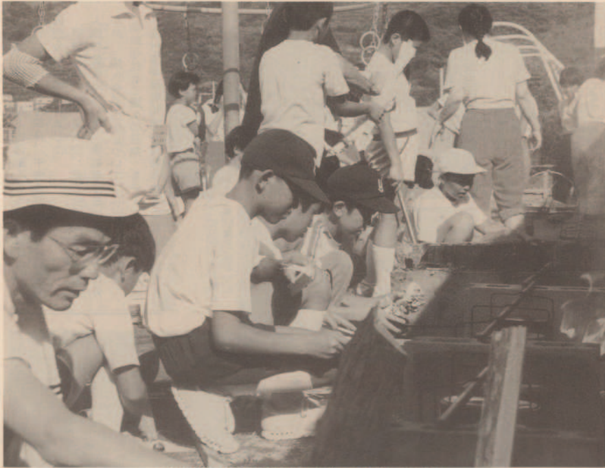
飯ごう炊飯は男子が担当、なかには焦がした班もありました