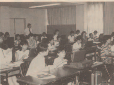
子供は大喜び、お母さんはたじたじ

七月二四日、町見公民館で夏休み親子ワープロ教室が開催されました。 えひめ生活センター友の会が主催、夏休み期間中の消費者関連行事の一環として行われたもので、親子連れなど三〇〇人余りが参加しました。 最初に操作のポイントを、いよいよ指導してもらいました。子供たちは呑み込みが早かったようですが、お母さんたちは小首をかしげたり、子供に教えてもらおう一幕もありました。 子供たちは大変喜んでいたので、親子で楽しみながら学習し、夏休みの思い出になった一日でした。