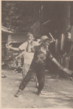
境内での「雨ごい」祈願

七月十六日に十四ミリの雨が降って以来、八月に入って雨がぜんぜん降らないことから、河内地区では、八月七日、地区の八坂神社で「雨ごい」祈願を行いました。 この日は、五十人あまりが集まり八坂神社にお参りしながら、太鼓を打ち鳴らしながら、雨たまわれ祇園堂、祇園堂が焼けるぞ」と、願をかけた。