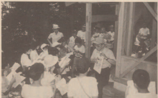
鯛ノ浦神社では落人の話を聞きました