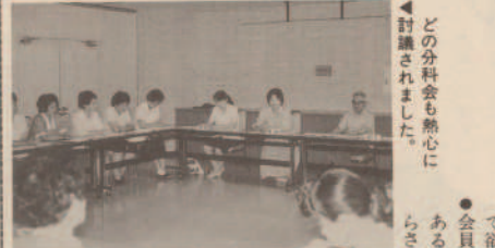
どの分科会も熱心に討議されました。

各分科会では、次のような意見が出されました。 ●第一分科会 「婦人会活性化に向けて」 ●婦人会員の低年齢化が進み、会員の減少と活動が停滞している。年齢制限をしている地区が多いようだが、せめて六〇歳までは会員にいて欲しい。