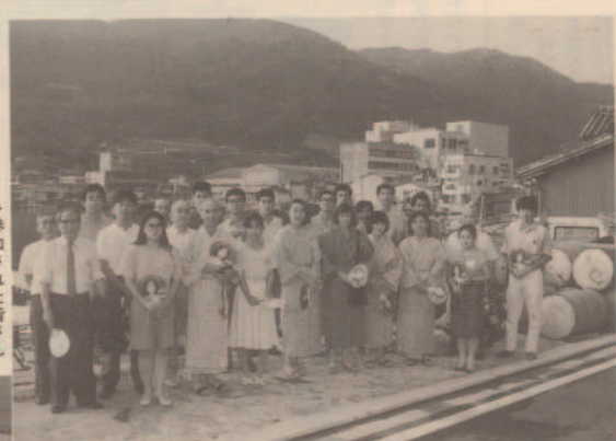
参加された皆さん

このあと、一緒に八幡神社の輪ぬけに参加。留学生は、うちわを片手に浴衣姿で、一見日本人と間違える方もありました。