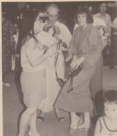
浴衣とゲタがとても似合っています。

浴衣姿の外国人留学生と町内の青年が、うちわ片手に交流。八幡神社の「輪ぬけ」を楽しました。