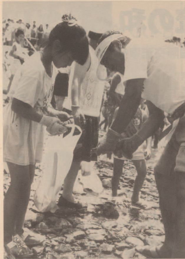
▲あばれる「うなぎ」を協力して袋の中へ… にぎわう、つかみどり大会▼

この祭は、町商工会設立三十周年を記念して行われたもので、地域社会に貢献する商工会を目指す活動の一環として、活力溢れる地域づくりと商工業の活性化を図るため、 商工会が中心となり、きなはいや伊方まつり実行委員会が開催したものです。 当日は、町内、外から五千人が参加。特産品の即売やカラオケ大会、映画、四電ふれ あい広場など、多彩な催しを楽しました。 特に、商工会前の伊方大川を塞ぎ止めて行われた、五百匹のうなぎと千匹のますのつかみどりで、川の中を元気に にさがし回る子供たちに対して、スポンを手に取り上げ真剣にうなぎに挑戦するおとぎさんの姿も見られ、涼しい水とつかみどりを楽しむ親子の歓声が川の中に響いていました。