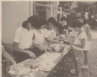
おいしいカレーができました

子供たちは、キャンプファイアができなかったことを残念がっていましたが、普段、体験できないことをしたり、多くの友だちをつくったりして、有意義に過ごした二日間でした。