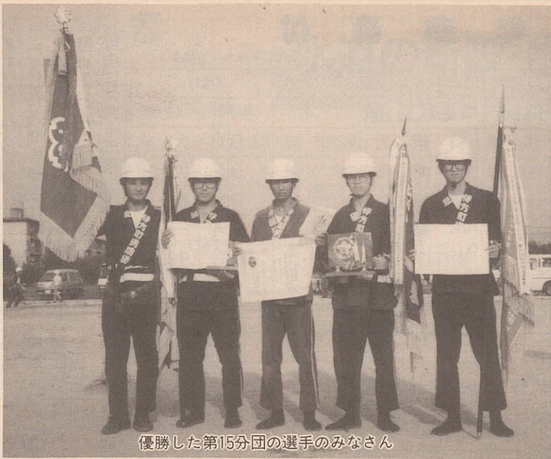
優勝した第15分団の選手のみなさん