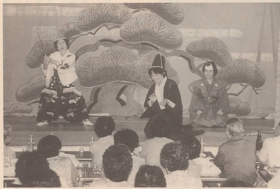
各地区で多彩な催しが行われた「敬老の日」(写真は中浦)