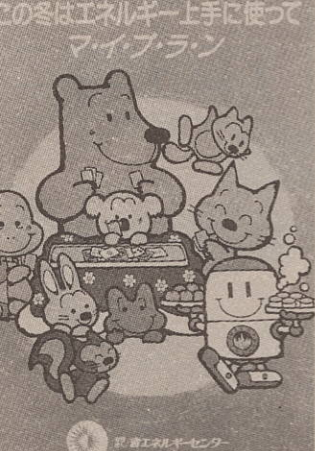
この冬はエネルギー上手に使ってマイプラン

家庭でできる省エネ対策 それではどうすればよいのでしょうか。 例えば、次のような点に気を使いましょ。 ▼冬の夜、家族が一部屋に集まって、コタツでくつろぐのはいいものです。このこたつの上掛けに、毛布を加え、こたつ敷きを使用すると、消費電力は約三〇パーセント少なくなります。 ▼窓の大きさにもよりますが、夜は雨戸を閉め厚手のカーテンをすることによって、暖房のときに一〇〜二〇パーセントの省エネルギー効果が上げられます。カーテンは、床まで届くものだと一層効果的です。