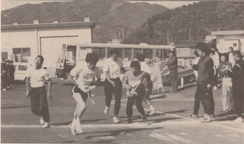
〔写真上〕田之浦集会所横をスタートする第1走者 〔写真下〕第8中継点

今年の大会には一部の地区対抗に十二チーム、二部のクラブ対抗に二十四チーム(男子の部十四チーム、女子の部十チーム)、オープン参加の二見小チームと伊方小教員チームの計三十八チームが参加、