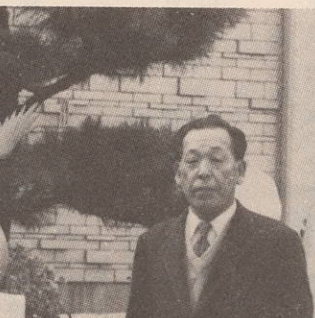
子供と共に歩む校長先生

過去四十年間、さまざまな起伏ある道程を歩みながらも、心身共にたくましい町中生の育成のために、先輩の校長先生方をはじめ、数多くの諸先生方、更にPTA会員の皆様方や地域の