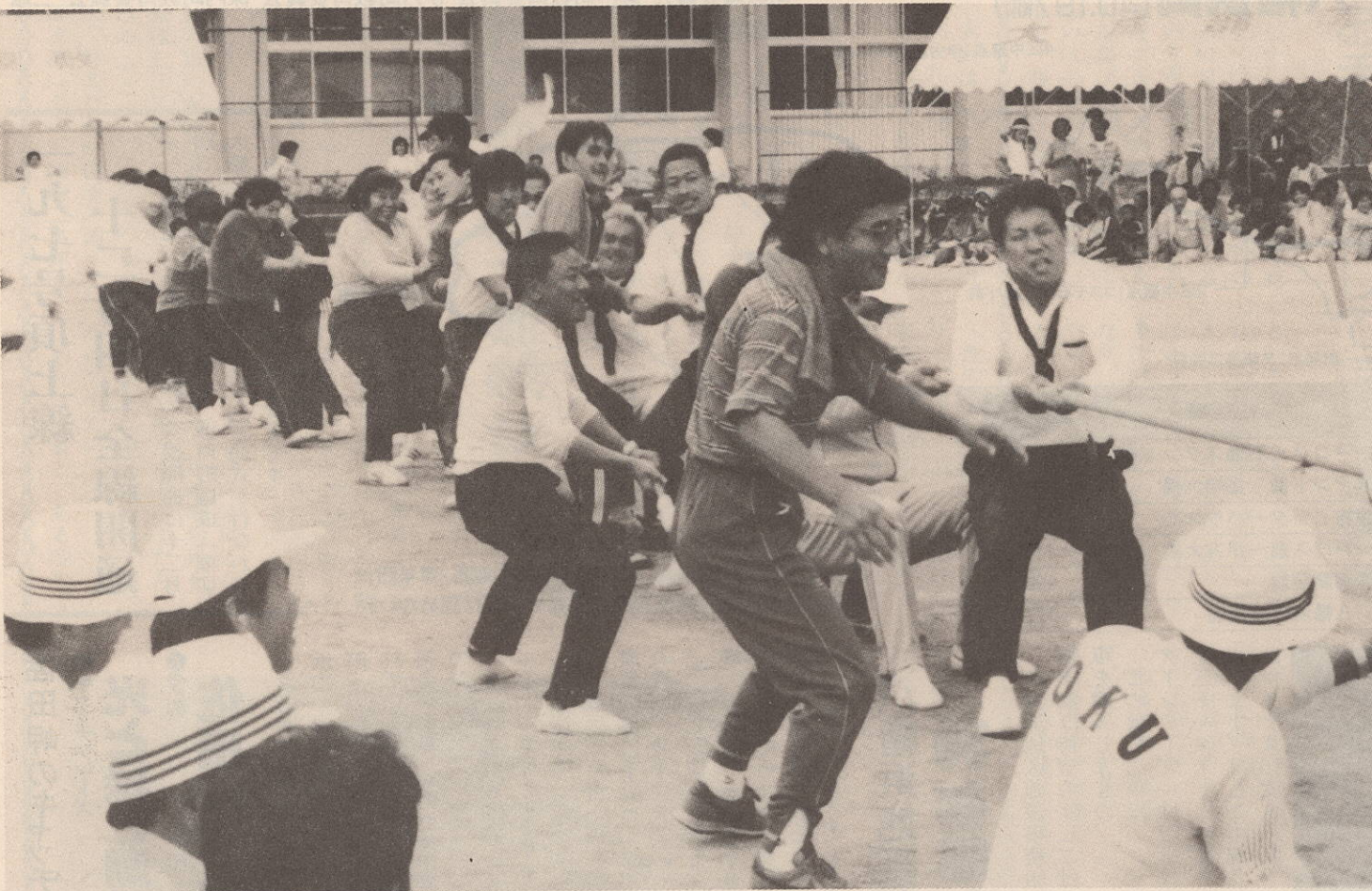
満身の力でオーエス(町見会場)