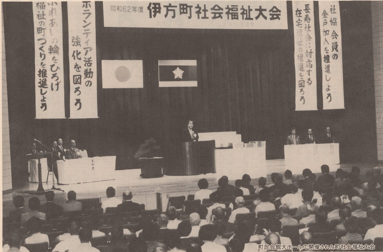
町民会館大ホールで開催された町社会福祉大会