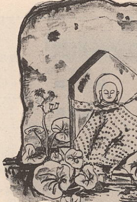
加周地区では、毎年、盂蘭盆の十四日には精霊を迎え慰めるた