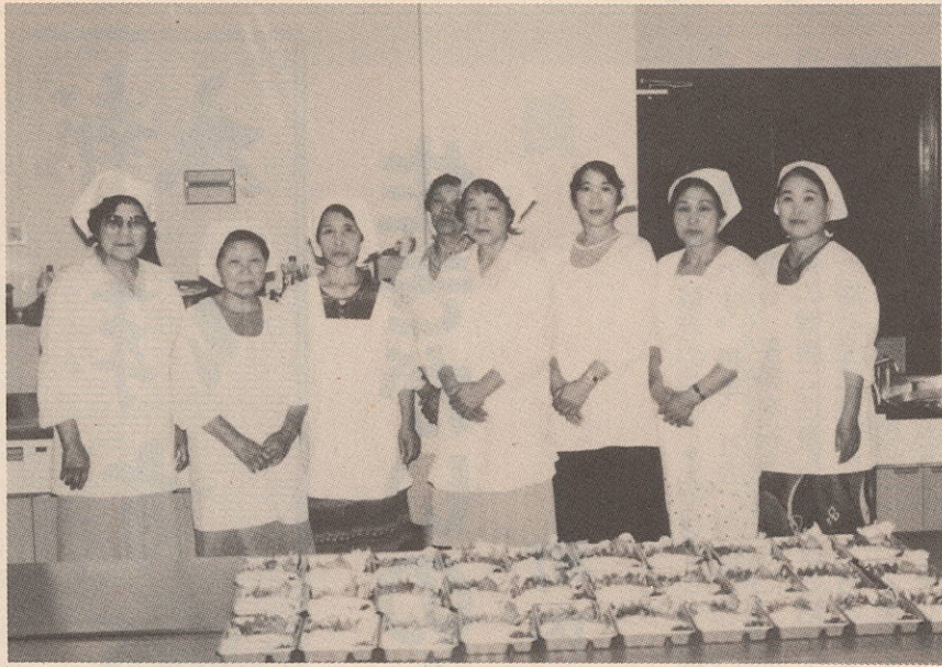
出来あがった弁当を前にボランティアのみなさん

高齢化の進むなかで、地域福祉としての在宅サービス事業の展開が強く望まれています。町では七月から独居老人に給食サービス事業を始めました。給食サービス事業は町社会福祉協議会が主体となり、在宅サービス事業の一環として独居老人を対象に一ヶ月に一回弁当を配食するものです。一部地域で試行してきましたが、七月から町全域を対象に実施することにしました。町内の対象者は六十九世帯六十九人。七月十七日に町見地区四十世帯、七月二十四日には伊方地区二十九世帯を実施しました。給食の弁当は町保健センターの栄養士の献立表をもとに、町見公民館、中央公民館の調理室を利用し、ボランティアの手によって作