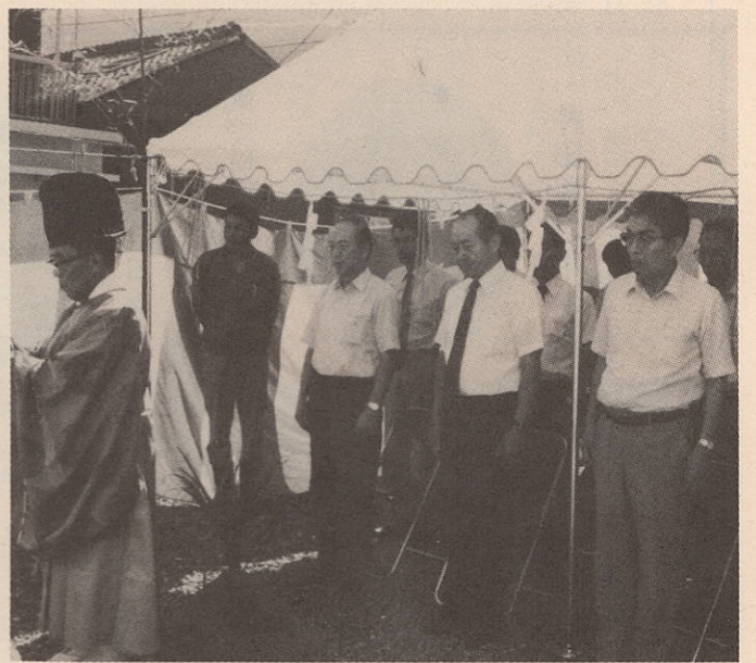
建設現場で行われた地鎮祭

昭和六十年一月一日から改正国籍法が施行され日本人の子で一定の条件を備えている外国人は、法務大臣へ届け出ることで日本の国籍を取得することができます。この届出によって日本の国籍を取得できる場合はいくつもありますが、そのうち、改正国籍法施行前に外国人父と日本人母との間に生まれた子の国籍取得の届出は、特に改正国籍法の施行日から三年以内(本年十二月三十一日まで)に限ってすることができるとされています。届出の期限が迫っていますので、この届出をしようとする人は、早目に最寄りの法務局に相談するようにしてください。 この届出により国籍を取得できる条件及び届出に必要な添付書類は、次のとおりです。 ☆条 件 (1)昭和四十年一月一日から昭和五十九年十二月三十一日までに生まれたこと (2)日本国民であったことがないこと (3)出生の時に母が日本国民であったこと (4)母が現に(又は死亡の時に)日本国民であること ☆添付書類 (1)出生届の記載事項証明書、出生証明書、分娩の事実を記載した母子健康手帳など (2)日本の国籍を取得しようとする人の出生時から現在までの母の戸(除)籍謄本(母が死亡しているときは、その死亡時までのもの) (3)外国の方式により父母が婚姻し、その婚姻が母の戸籍に記載されていない場合は、婚姻を証する書面 国籍取得の届出をするには、国籍の取得をしようとする人の住所を管轄する法務局・地方支庁又はその支局にこれらの書面を届書とともに提出していただきますが、日本の国籍を取得しようとする人が十五歳以上のときは本人が、十五歳未満のときは親権者、後見人などの法定代理人が自ら法務局に届出しなければなりません。 なお、届出をする際は、次のことにも注意してください。 ①国籍取得の届出によって日本の国籍を取得したときは、それによって現在有している外国の国籍をその国の法律により当然に失う場合があります(例えば韓国など)。 ②法務局で届出を受け付けられた後は、届出を取り下げることができません。 ③届出によって日本の国籍を取得したときは、法律で定まる日本人である父又は母などの氏を称し、その戸籍に入るようになります。 ④届出によって日本の国籍を取得したときは、戸籍を作るため、戸籍の届出を市町村長にしなければなりません。 ⑤届出によって日本の国籍を取得したことに重国籍となつた人は、法律の定める期限までにいずれかの国籍を選択しなければなりません。 詳しくは、松山地方支局八幡浜支局(TEL 二二二〇六九六)