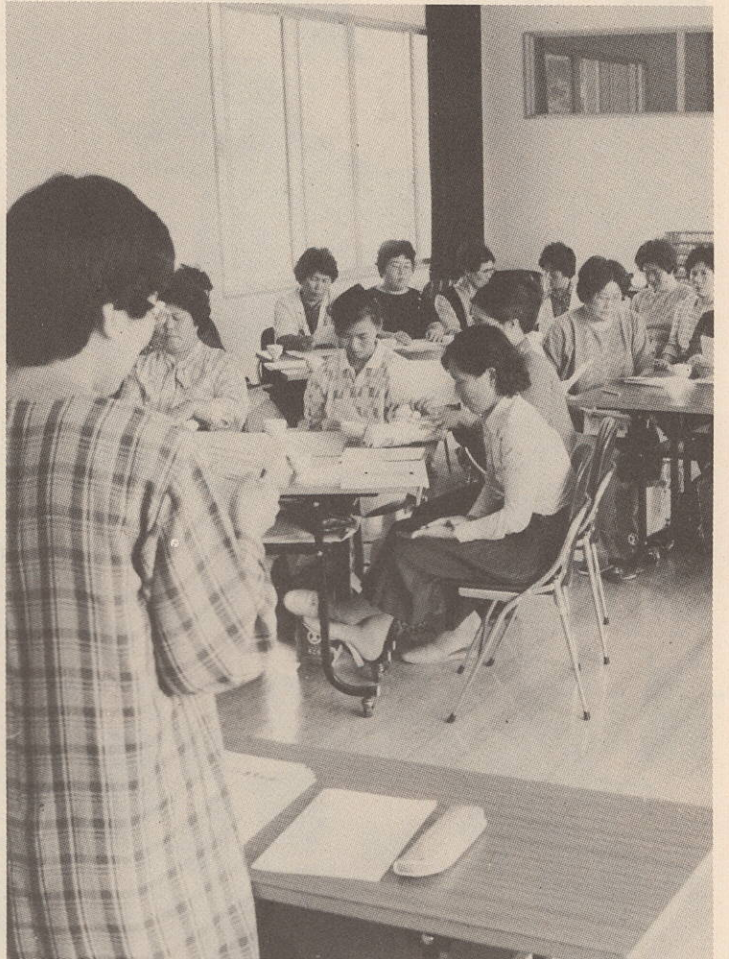
保健センターで開かれた第1回保健推進員研修会