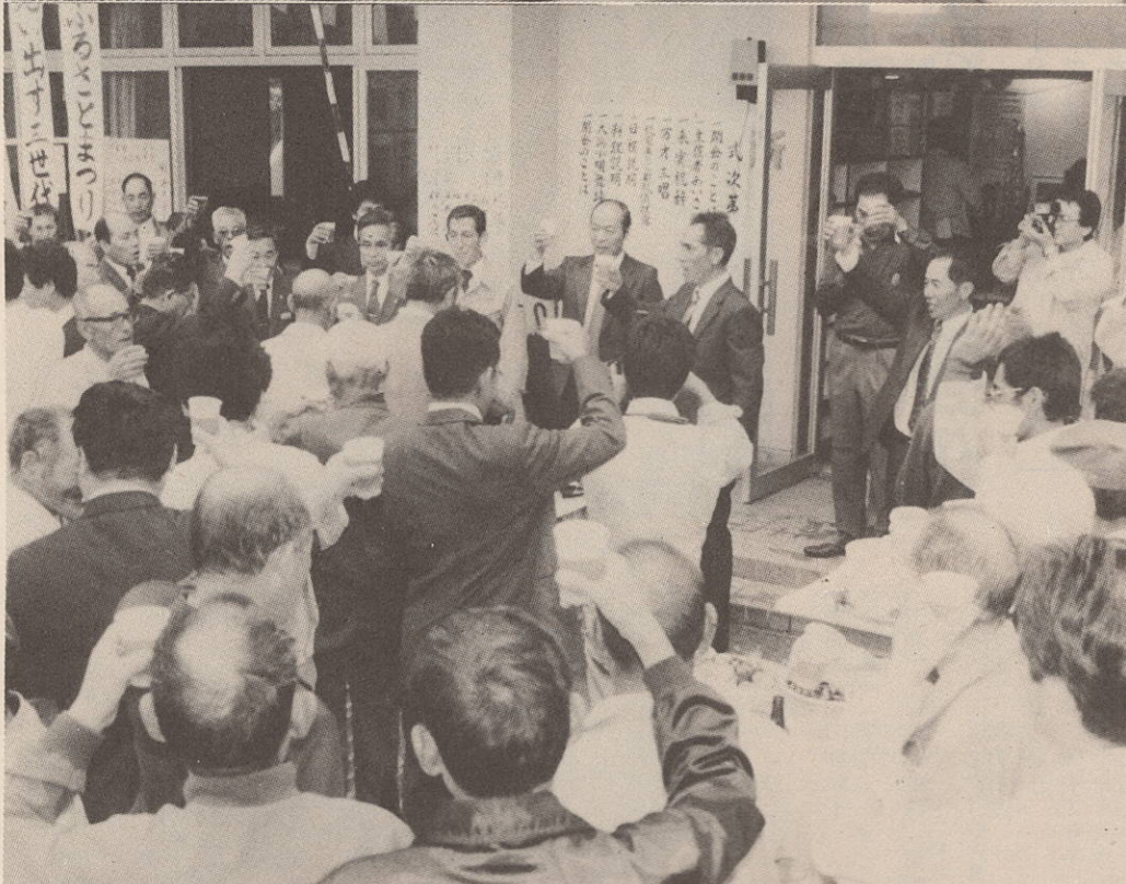
（写真上）昔なつかしい料理に舌鼓 （写真下）集会所前で行われた開会行事