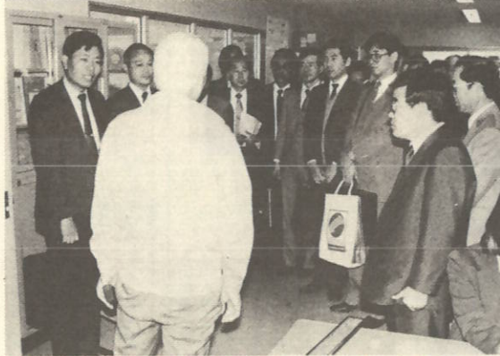
指定後初めて、実務担当者で構成するクーキンググループ15人が八西地域を視察。西宇和青果を見学したあと最初の打合せ会を開く。

パッケージ系ではビデオディスクなどが主なもの。こうした構想は、よりコンパクトなものを使って一度に多くの情報を伝達できる光ファイバーケーブルの開発、あるいは人工衛星などの技術進歩が要因になっています。今回、八西地区が通産省の指定を受けたからといって、すぐ導入されるとは限りませんが、導入できるか、経済性や地域に与える影響はどうかなどの調査をして検討しようというのが通産省の計画です。