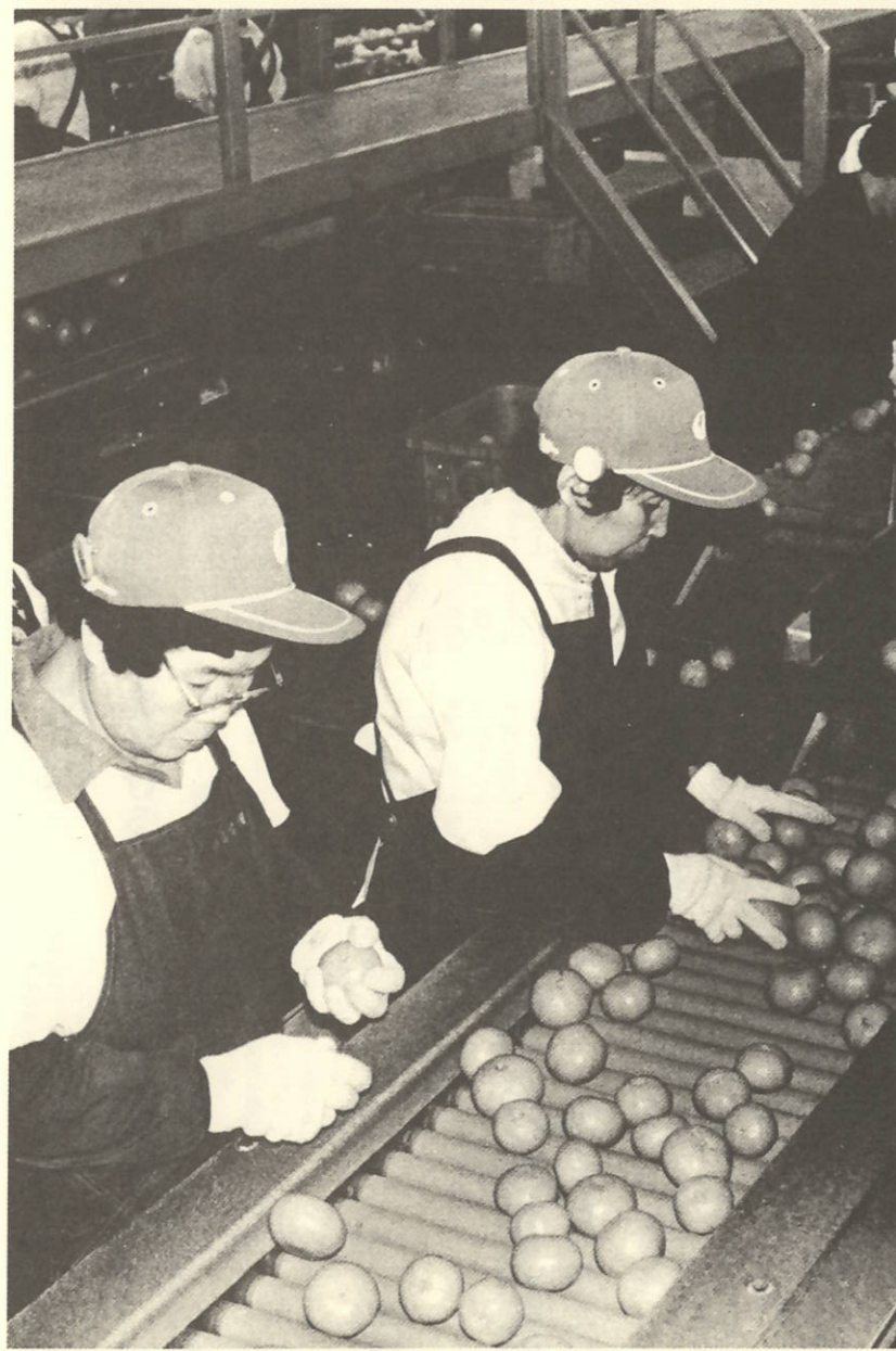
慣れた手つきですばやい採果。伊方町農協の⑧共撰場には、みかんを満載したトラックがひっきりなし。選果機もフル運転で、活気にあふれています。

実りの秋。町内の山々は黄金色に染まり、農家では温州みかんの採り入れに追われています。今年の温州みかんは不作。昨年より三割以上も減っています。しかし、味がよく売れ行きも好調で、市場価格は高値が続いています。