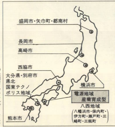
ニューメディア・コミュニティ構想モデル地域

モデル地域に指定された八西地域では、通産省の委託を受けた財団法人ニューメディア開発協会（東京）による現地調査が始まりました。現地調査では、東京にある三菱総合研究所が主体となり、結成されたクーキンググループと呼ばれる実務担当者の会（民間会社に属・八幡浜市・伊方町・西宇和青果などが加わり十五人で構成）が中心となって進められ、経済性や地域に与える影響、住民の意識調査などを実施する予定です。こうした調査された資料を基に研究討議を重ね、県のニューメディア推進協議会などの意見と調整。来年三月ごろまでにシステム案を通産省へ提出することになります。これを受けて通産省では、六十年度に設計開発、六十一年度に構築実験、六十二年にシステム運用にこぎつける計画です。