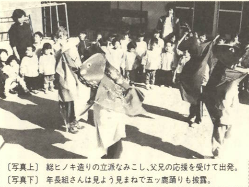
【写真上】 総ヒノキ造りの立派なみこし、父兄の応援を受けて出発。 【写真下】 年長組さんは見よう見まねで五ツ鹿踊りも披露。

六年前に地元のかたから総ヒノキ造りの立派なみこしの寄付を受けたのがきっかけで始まったこの行事。今では川永田の秋祭りの恒例行事の一つで、角々には父兄や近所の人が大勢出て声援、その日のハッピーの勇ましく立立ちを、盛んにカメラに納めていました。