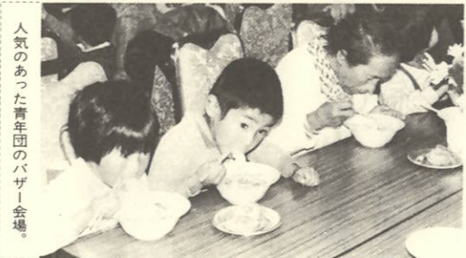
人気のあった青年団のバザー会場。

それぞれの会場には盆栽展や菊花展など多彩な催し物が行われ、みごとに作品に見入っていました。中でも青年団バザー・米まつり・ふるさと大会に人気が集っていたようです。