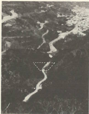
伊方調整池(点線はダム予定地点)

「昭和六十年度には野村ダムから水が……、待ち望んでいた水がようやく来るめどができました。」 農業、水。特に伊方町のよきな地形や気象条件では必要不可欠な要素です。 わたしも農業を営む一人として、水に苦しんだことが何度となくあります。昭和四十二年の太平ばつには、みかんの木が「枯れてしまうのでは」と思ったほどです。 伊方町では町の理解により、地元負担のほとんどを町費で