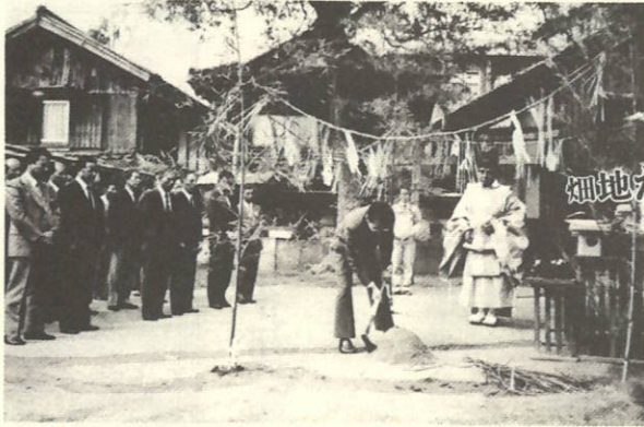
工事関係者30人が出席して行われた起工式。

慢性的な水不足に悩まされてきた本町。とりわけ大量に必要な農業用水の確保は、これからの農業振興の大きな課題でした。 この課題解消の切り札は、現在国が実施している南子用水農業水利事業です。 その関連事業の一つ、灘地区畑地かんがい事業の起工式が十月十三日現地の大河で行われました。