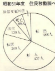
昭和51年度 住民移動動向