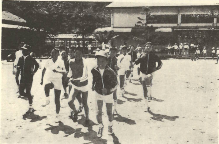
サーキットトレーニング

九町小学校では、昭和五十年十月から毎週火、木曜日の三回が多いといわれる現代っ子。その一をもとに全児童がなかなかな業間体操を実施して大きな成果を上げています。現在では町内各小学校とも実施