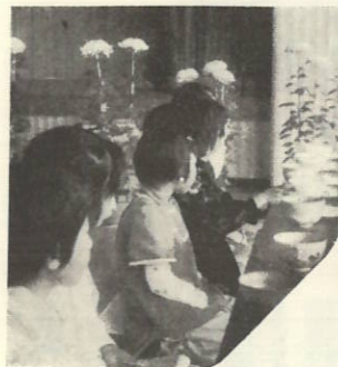
ちびっ子も姿勢よろしく、茶道の手ほどきを受けました。