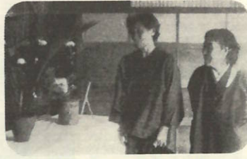
自然の秋を多感に表現した作品が多数出品されました（生け花）

九月中旬さやかな祭式も心の豊かさを求め、町民みんなの心ある人たにようほられていの手で築きたものです。