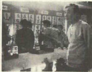
小中学生の迫力ある力作が、多く展示されました。（書道）