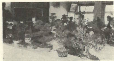
見事な盆栽のてきばえに観覧者も思わずうっとり