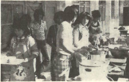
青年団も参加してのバザー（うどん、ぜんざいを販売）