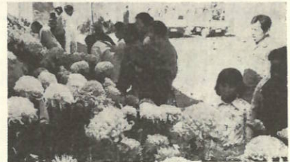
精進こめてつくった菊花の香りが会場いっばいに漂っていました。