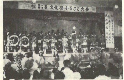
明演をいろどる伊方小学校児童のトランペット鼓隊

心の豊かさを求め、町民総ぐるみでふるさとづくりを……と 第1回伊方町文化祭は11月2～3日の2日間、町内各会場（中央公民館、伊方小学校、九町小学校）にわかれはなやかに開催しました。 本格的な文化祭は本年がはじめてで、その内容も多彩で書画、生け花、盆栽、菊花、茶道、俳句、吟詠、意見発表、民謡、記念講演、バザーといずれも伊方の風土にはぐまれたものばかりで観賞に訪れた町民の目を楽しませました。そこで本号では、文化の秋をいつそう盛り上げた、町文化祭のようすを紹介します。