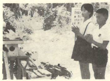
児童代表2人が玉串を奉奠しました。

完成まで工事の無事を祈る起工式が八月十四日伊方小学校の建二階末完成をめぐりスタートをきったわけです。 当日は工事担当者(大成建設、設計監理者(大建設))松山市、町側から町長、収入役、教育長、伊方小改築特別委員長、町議会議員、P.T.A.会長、学女長、児童代表、男女各一名、男女関係者多数が列席し、玉串奉奠、町長の御挨拶がなされました。