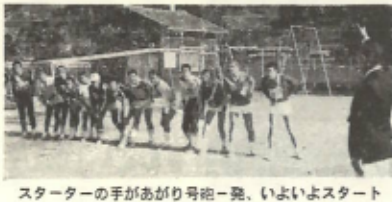
スターターの手があがり号砲一発、いよいよスタート