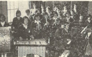
楽器から流れる曲は、暖かい友愛で結ばれました