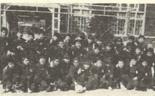
肩を組み合い、肌と肌の交流で友情が芽ばえました

「健康」にそれこれ 気がくばられておられることと思います。が、あまりガミガミイライラ指導はいけません。