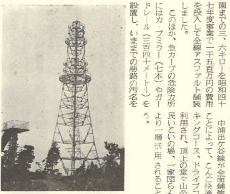
パラボラアンテナの取付けを待つ無線中継塔

堂々山公園の興く完成了。望台横に国鉄の手、鉄塔はパラボラアンテナがとによって無線中継につけられ新幹線の電波送信が塔が現在建設されています。堂々山(標高四〇七メートル)これは、国鉄の昭和三十六年六月完成し山陽新幹線建設に電々公伊方統制無線中継所が伴う東京、門司、あるほか、電々公は、もう一間を結ぶ無線中継基無線中継所の建設が進められて所の第二ルートとあり、山の頂上はマイクローエーして新設されるもブの基礎はなりつてあります。公園まで全線舗装が地上四十五メートルあり、ちうす町では、町道中浦出ヶ公園であ