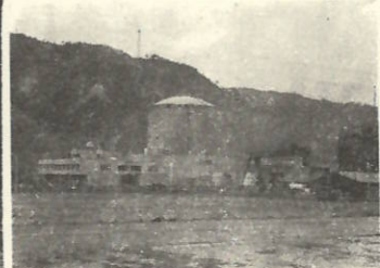
音もなく、煙もなく、構内には人影さえない運転を開始した敦賀原子力発電所

原電視察アンケート結果 大多数が誘致を主張 町では昨年二つ所は、二基建設されたり第一号が誘致された方がよいと思う(六)の人が多く、六月十四日、原電視察の結果、約九十五名にアンケートの結果、誘致を主張している。 また、第二号基については現在五日の両原、原電視察の結果、約九十五名にアンケートの結果、誘致を主張している。 また、第一号基については現在五日の両原、原電視察の結果、約九十五名にアンケートの結果、誘致を主張している。