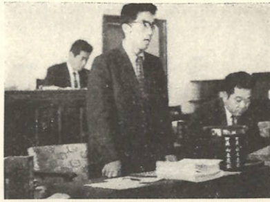
昭和三十九年度町政の大綱をきめる定例町議会の様子

今回の町 予算の内容においても、歳入歳出のバランスをとりつつは、方財政制度 予算のほかに継続費、地方債など、その全部を置き、地方自治法制定以来初めての全面的な改訂であり、予算制度において、が著しく広くなるとは、歳入は、住民にわかりやすいという、歳出予算に直接関連するもの、あるいは将来必ず財政負担を伴い、昭和三十九年度一般会計歳入歳出とに重点がおかれたものです。