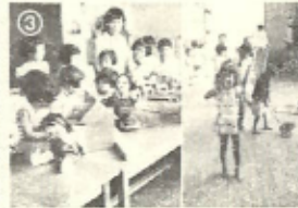
③自動車のおもちゃで遊ぶ子どもたち。