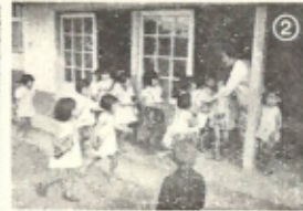
②一日は朝の健康観察から始まります。