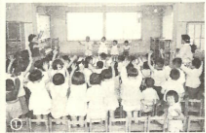
①毎月一回の誕生会は、その月に生れた子供を祝います。今日は四人の子供がうれしそうに踊っています。