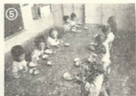
④口をむねにやぐ動かしておひるねの時間。